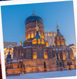
โบสถ์เซินโซเฟีย