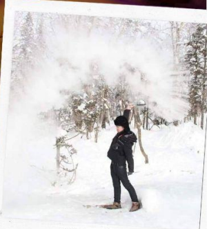
ภาพเขียน ICE AND SNOW