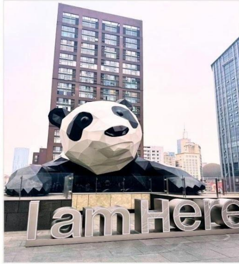
หมีแพนด้ายักษ์ กำลังป็นตึก IFS