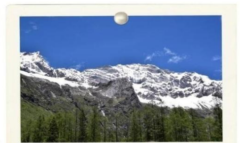
ภูเขาสีดรุณี (Siguniang)