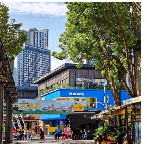
ตงเจียวจี้ (Eastern Suburb Memory)