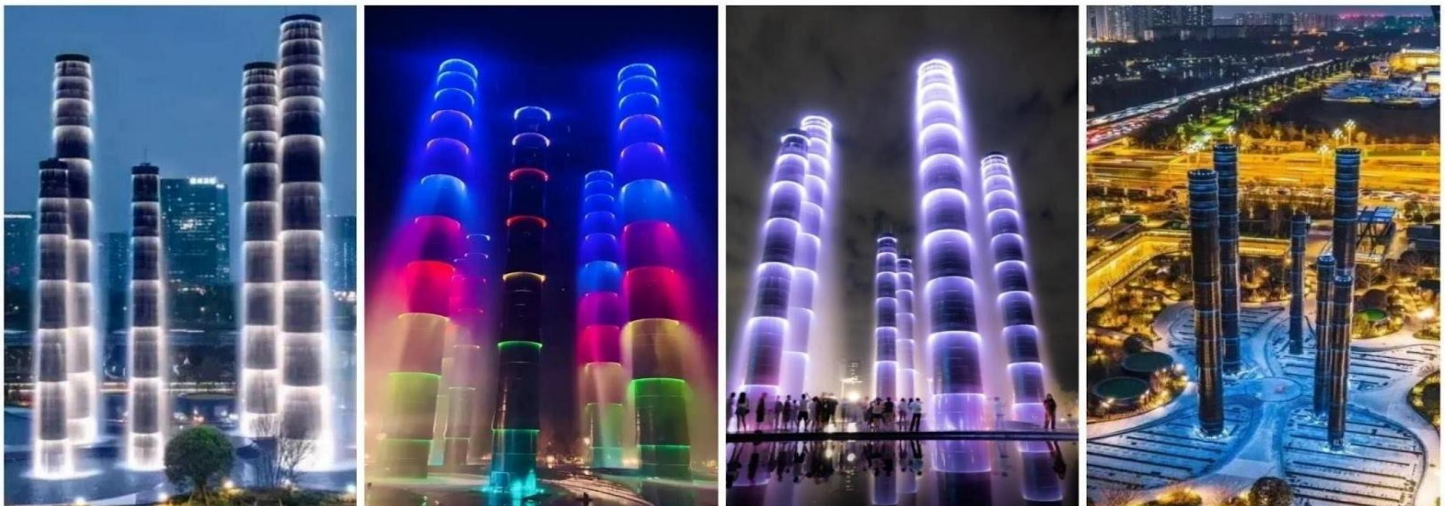
ชมแสงสี The Tower of Life

จากนั้นพาท่านไป ช้อปปิ้งที่ห้างหรู SKP แลนด์มาร์คที่ล้ำสมัยที่สุดในเมืองเฉิงตูเวลานี้ ห้างสรรพสินค้าลึกลับที่ไม่มีใครได้แค่ขายของแบรนด์เนมแต่คือการปฏิวัติวงการสถาปัตยกรรมด้วยคอนเซ็ปต์สวนสาธารณะบนดิน ห้างหรูใต้ดิน" บนพื้นที่รวมกว่า 5 แสนตารางเมตร ความพิเศษที่ทำให้ Chengdu SKP แตกต่างจากที่อื่นคือการสร้างห้างลึกลงไปใต้ดินถึง 5 ชั้น โดยที่พื้นที่ระดับพื้นดินถูกเปลี่ยนเป็นสวนสาธารณะสีเขียวขนาดใหญ่