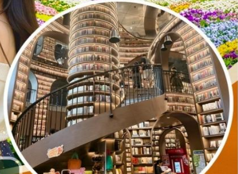
จงซูเก๋อ