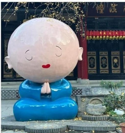
วัดต้าเจี๊ว

นำท่านสู่ ถนนคนเดินไท่กู๋หลี สัมผัสบรรยากาศแหล่งช้อปปิ้งสุดหรูที่ผสมผสานสถาปัตยกรรมแบบวัดโบราณกับตึกสมัยใหม่ได้อย่างลงตัว