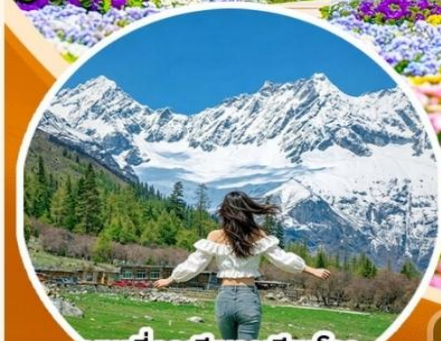
ภูเขาสีดรุณี ช่วงเดียวโกว (รวมรถอุทยาน)