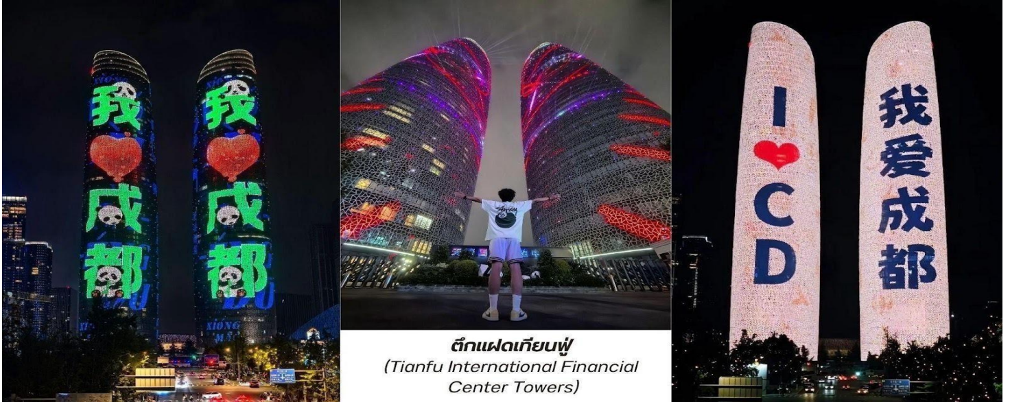
ตึกแฝดเทียนฟู (Tianfu International Financial Center Towers)

จากนั้นพาท่านไป ช้อปปิ้งที่ห้างหรู SKP แลนด์มาร์คที่ล้ำสมัยที่สุดในเมืองเฉิงตูเวลานี้ ห้างสรรพสินค้าลึกลับที่ไม่มีใครได้แค่ขายของแบรนด์เนมแต่คือการปฏิวัติวงการสถาปัตยกรรมด้วยคอนเซ็ปต์สวนสาธารณะบนดิน ห้างหรูใต้ดิน" บนพื้นที่รวมกว่า 5 แสนตารางเมตร ความพิเศษที่ทำให้ Chengdu SKP แตกต่างจากที่อื่นคือการสร้างห้างลึกลงไปใต้ดินถึง 5 ชั้น โดยที่พื้นที่ระดับพื้นดินถูกเปลี่ยนเป็นสวนสาธารณะสีเขียวขนาดใหญ่