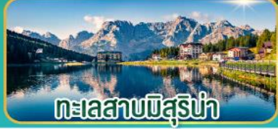
ทะเลสาบมิสุร์น่า