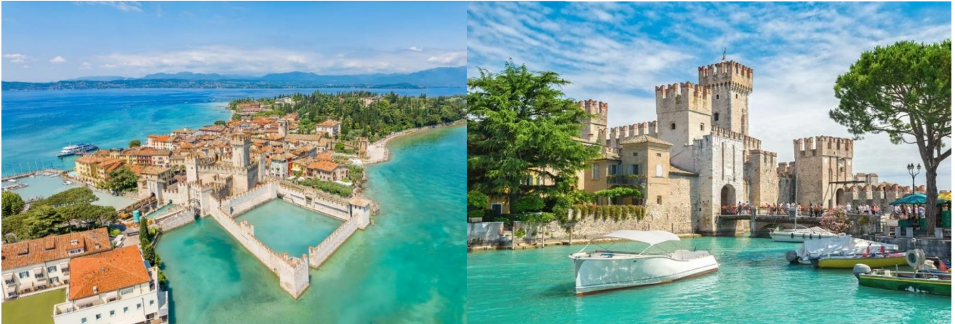
กลางวัน อิสระอาหารกลางวันตามอัธยาศัย