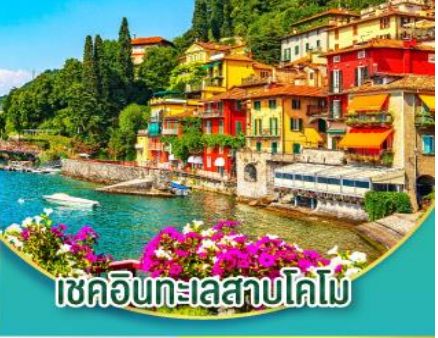
เซคอินทะเลสาบโคโม