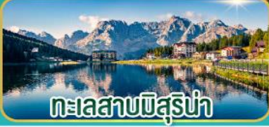
ทะเลสาบปีสุริ่น่า