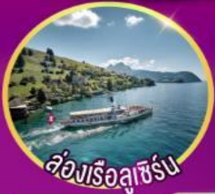
ล่องเรือลูซิิร์น