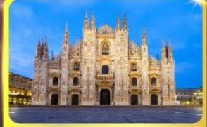
มหาวิหารแห่งเมืองมิลาน