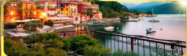
ทะเลสาบโลโม