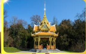
ศาลาไทยโยชามณี