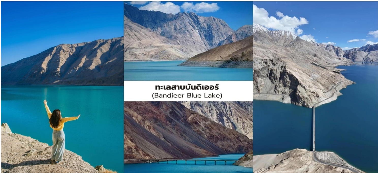
ทะเลสาบบันดิเออร์ (Bandieer Blue Lake)

จากนั้นนำท่านเปลี่ยนการเดินทางในช่วงนี้โดยใช้ รถยนต์ 7 ที่นั่ง ตามที่กำหนด เพื่อให้สามารถลัดเลาะไปตามเส้นทางภูเขาที่คดเคี้ยวได้อย่างสะดวกและปลอดภัย นับเป็นอีกหนึ่งประสบการณ์การเดินทางบนถนน ภูเขาที่มีเอกลักษณ์ที่สุดแห่งหนึ่ง ของเส้นทางท่องเที่ยวในจีนเฉียง