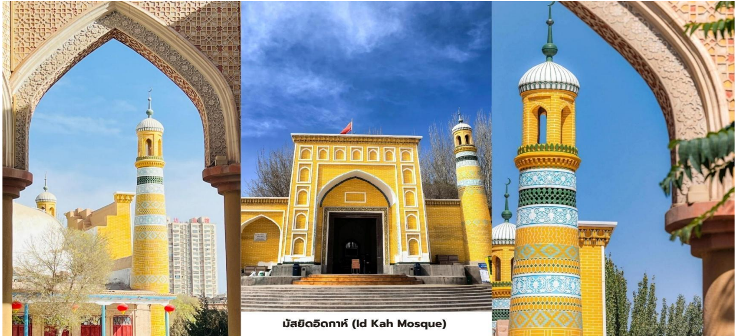
มัสยิดอิคคาห์ (Id Kah Mosque)

สมควรแก่เวลานำท่านเดินทางสู่สนามบินคัชการ์ (Kashgar Airport) บินภายในประเทศสู่เมืองหลานโจว