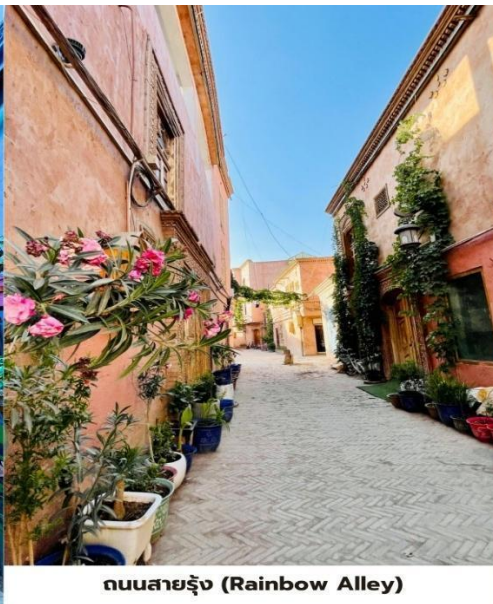
ถนนสายรุ้ง (Rainbow Alley)