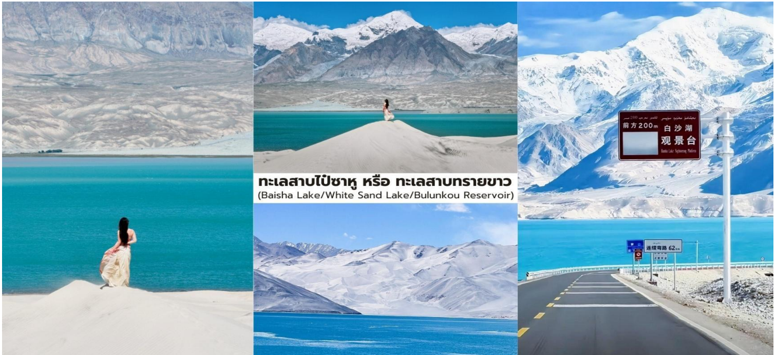
ทะเลสาบไปซาหู หรือ ทะเลสาบทรายขาว (Baisha Lake/White Sand Lake/Bulunkou Reservoir)

บาย นำท่านเที่ยวชม ทะเลสาบคารากูล (Karakul Lake) ทะเลสาบธารน้ำแข็งขนาดใหญ่ ที่ตั้งอยู่บนความสูงประมาณ 3,600 กว่าเมตรเหนือระดับน้ำทะเล บริเวณเชิงเขามูซทากหรืออาตาค่าว่า "คารากูล" ในภาษาเตอร์กหมายถึง "ทะเลสาบดำ" แต่ในวันที่อากาศแจ่มใสผืนน้ำของทะเลสาบจะปรากฏเป็น สีน้ำเงินคราม และทำหน้าที่เสมือน กระจกเงาธรรมชาติขนาดใหญ่ ที่สะท้อนภาพของภูเขาหิมะและท้องฟ้าออกอย่างสวยงามบริเวณรอบทะเลสาบเป็นถิ่นอาศัยของ ชนเผ่าคีร์กีซ ที่อาศัยอยู่ในบ้านแบบ ยูร์ต (Yurt) ซึ่งเป็นที่พักแบบดั้งเดิมของ ชนเผ่าเร่ร่อนในเอเชียกลาง นักท่องเที่ยวสามารถเดินชมทัศนียภาพรอบทะเลสาบและสัมผัสบรรยากาศธรรมชาติของที่ราบสูงปามีร์ที่เงียบสงบถือเป็นหนึ่งในจุดชมวิวกูเขาหิมะและทะเลสาบที่สวยงามที่สุดของเส้นทางสายปามีร์