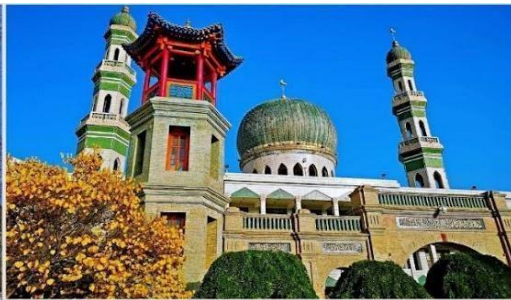
มัสยิดตงกวน (Dongguan Mosque)