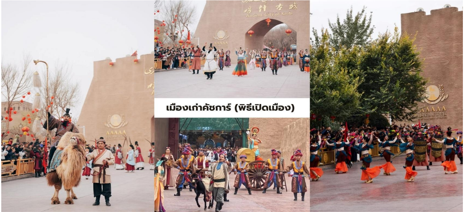
เมืองเก่าคัชการ์ (พิธีเปิดเมือง)

จากผ้าไหม Atlas และสวมหมวกดอกไม้ Doppa แดงในบางช่วงการแสดงจะมีการแต่งกายเป็นนักรบโบราณที่มาพร้อมกับชุดเกราะแบบจัดเต็มด้วย สร้างบรรยากาศที่สะท้อนเอกลักษณ์ของวัฒนธรรมเอเชียกลางได้อย่างชัดเจน ในส่วนของพิธีนี้ จะจัดขึ้นในช่วงเวลาประมาณ 10:30 น. ของทุกวัน แนะนำให้มาถึงก่อนเวลาเล็กน้อยเพื่อเลือกมุมถ่ายภาพที่สวยงาม