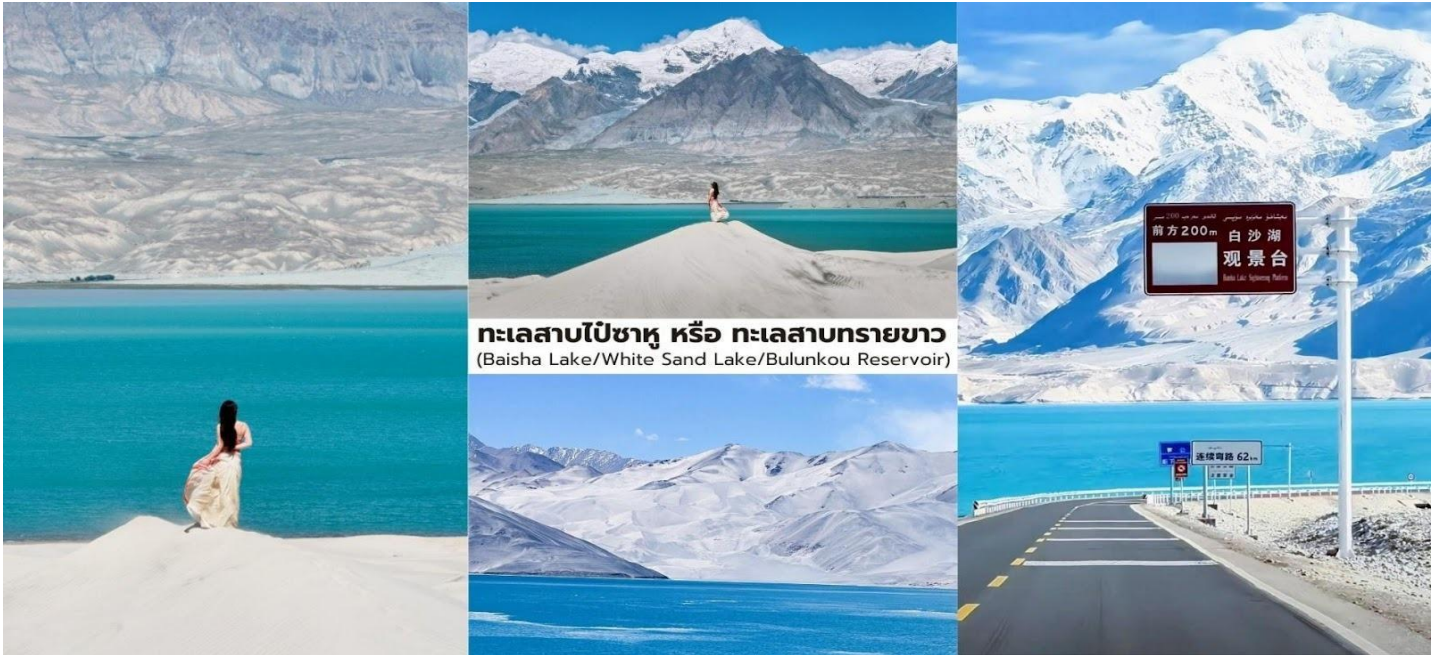
ทะเลสาบไ้ซาหู่ หรือ ทะเลสาบทรายขาว (Baisha Lake/White Sand Lake/Bulunkou Reservoir)

บาย นำท่านเที่ยวชม ทะเลสาบคารากูล (Karakul Lake 喀拉库勒湖) ทะเลสาบธารน้ำแข็งขนาดใหญ่ ที่ตั้งอยู่บนความสูงประมาณ 3,600 กว่าเมตรเหนือระดับน้ำทะเล บริเวณเชิงเขามุซทากหรืออาตาคำว่า "คารากูล" ในภาษาเตอร์ก หมายถึง "ทะเลสาบดำ" แต่ในวันที่อากาศแจ่มใสผืนน้ำของทะเลสาบจะปรากฏเป็น สีน้ำเงินคราม และทำหน้าที่เสมือน กระจกเงารธรรมชาตินขนาดใหญ่ ที่สะท้อนภาพของภูเขาหิมะและท้องฟ้าออกมาอย่างสวยงาม บริเวณรอบทะเลสาบเป็นถิ่นอาศัยของ ชนเผ่าคีร์กีซ ที่อาศัยอยู่ในบ้านแบบ ยูร์ต (Yurt) ซึ่งเป็นที่พักแบบดั้งเดิมของชนเผ่าเร่ร่อนในเอเชียกลาง