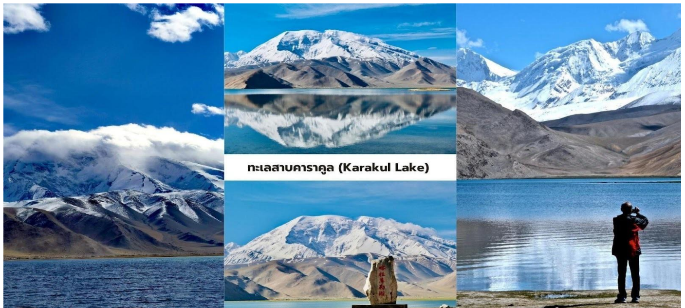
ทะเลสาบคารากูล (Karakul Lake)

นักท่องเที่ยวสามารถเดินชมทัศนียภาพรอบทะเลสาบและสัมผัสบรรยากาศธรรมชาติของที่ราบสูงปามีร์ที่เจียบสงบ ถือเป็นหนึ่งในจุดชมวิวกูเขาหิมะและทะเลสาบที่สวยงามที่สุดของเส้นทางสายปามีร์