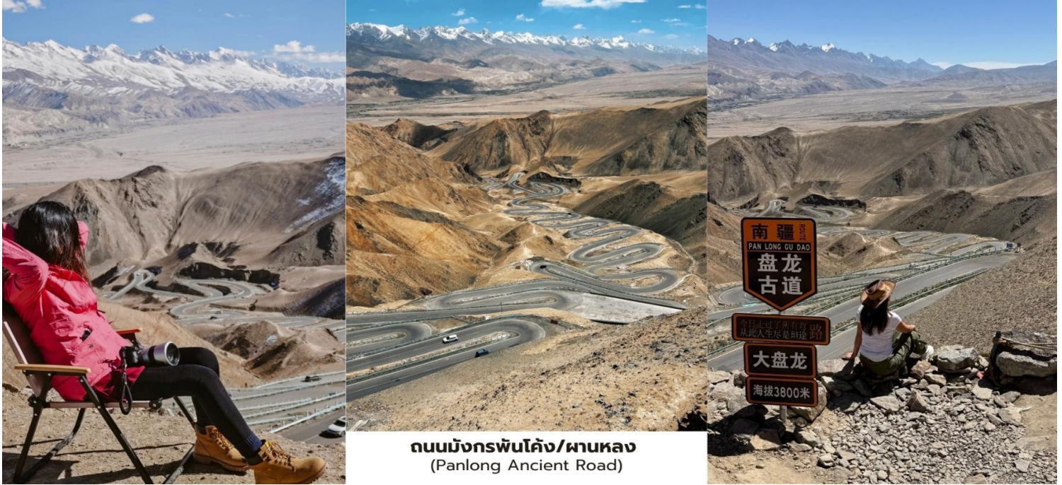
ถนนมังกรพันโค้ง/ผานหลง (Panlong Ancient Road)

ชื่นเฉียงระหว่างการเดินทางท่านจะได้สัมผัสทัศนียภาพของภูเขาหิมะแห่งเทือกเขาปามีร์และภูมิประเทศแบบที่ราบสูงอันกว้างใหญ่ถนนที่ทอดตัวขึ้นลงตามสันเขาทำให้เกิดมุมมองที่สวยงามและน่าตื่นตาตื่นใจเหมาะสำหรับการชมวิวและถ่ายภาพ