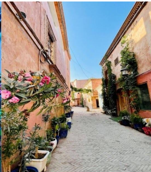
ถนนสายรุ้ง (Rainbow Alley)