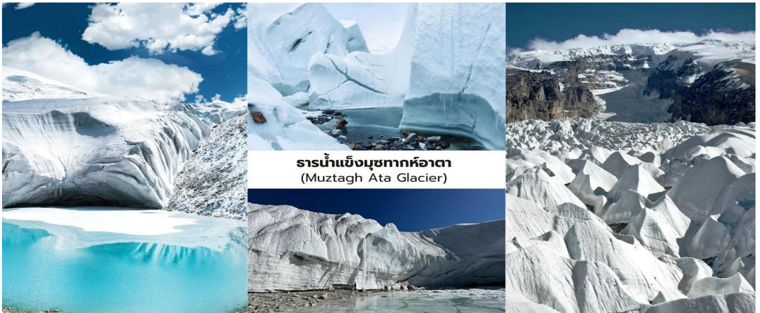
ธารน้ำแข็งฆามูซาทากห้อตา (Muztagh Ata Glacier)

นำท่านเที่ยวชม ธารน้ำแข็งฆามูซาทากห้อตา (Muztagh Ata Glacier 慕士塔格冰川) หนึ่งในภูมิทัศน์ธรรมชาติที่ยิ่งใหญ่ในเขตซินเจียง โดยมีฉากหลังเป็น ภูฆามูซาทากห้อตา (Muztagh Ata) หรือที่ได้รับความนิยมว่า "บิดาแห่งเหล่าภูเขาน้ำแข็งทั้งหมด" (Father of Ice Mountains) ตั้งอยู่ในเทือกเขาปามีร์ มีความสูงประมาณ 7,546 เมตรเหนือระดับ น้ำทะเล และถือเป็นหนึ่งในยอดเขาหิมะที่ยิ่งใหญ่ของภูมิภาค จากนั้นลัดเลาะเข้าไปยังบริเวณเชิงเขาเพื่อชม ธารน้ำแข็งขนาดใหญ่ ที่ไหลลงมาจากยอดเขา ท่ามกลางทัศนียภาพของภูเขาคิมะและทุ่งน้ำแข็งที่ทอดยาวสุดสายตาให้ความรู้สึก