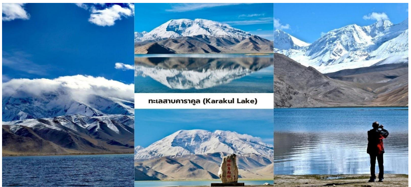
ทะเลสาบคารากูล (Karakul Lake)

นักท่องเที่ยวสามารถเดินชมทัศนียภาพรอบทะเลสาบและสัมผัสบรรยากาศธรรมชาติของที่ราบสูงปามีร์ที่เจียบสงบ ถือเป็นหนึ่งในจุดชมวิวภูเขาหิมะและทะเลสาบที่สวยงามที่สุดของเส้นทางสายปามีร์