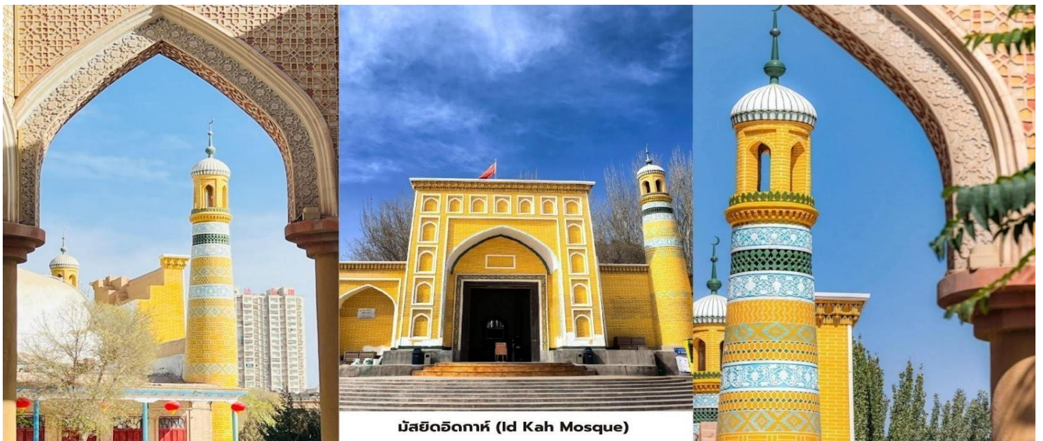
มัสยิดอิคคาห์ (Id Kah Mosque)

**หมายเหตุสำคัญ** เนื่องจากส่วนหนึ่งของโปรแกรมผ่านเขต Tashkurgan ซึ่งติดชายแดนปากีสถาน และอัฟกานิสถานนักท่องเที่ยวทุกท่านจึงจะต้องมีใบอนุญาตเดินทาง ซึ่งทางทัวร์จะดำเนินการให้