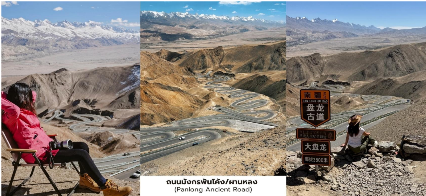
ถนนมังกรพันโค้ง/ผานหลง (Panlong Ancient Road)

ชื่นเฉียงระหว่างการเดินทางท่านจะได้สัมผัสทัศนียภาพของภูเขาหิมะแห่งเทือกเขาปามีร์และภูมิประเทศแบบที่ราบสูงอันกว้างใหญ่ถนนที่ทอดตัวขึ้นลงตามสันเขาทำให้เกิดมุมมองที่สวยงามและน่าตื่นตาตื่นใจเหมาะสำหรับการชมวิวและถ่ายภาพ