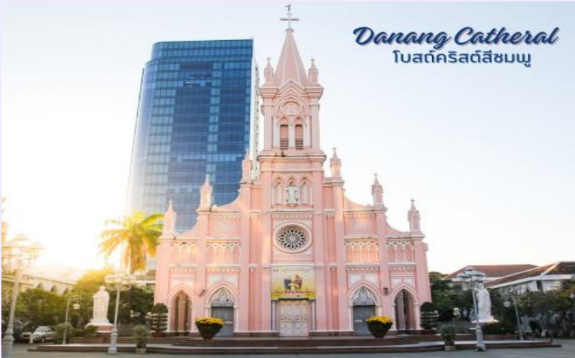
Danang Cathedral โบสถ์คริสต์สีชมพู

นำท่านถ่ายรูป โบสถ์คริสต์ดานัง หรือโบสถ์คริสต์สีชมพู (Danang Cathedral) สร้างขึ้นสมัยเวียดนามตกเป็นอาณานิคมของฝรั่งเศส สถาปัตยกรรมสไตล์โกธิก ยตกแต่งด้วยความประณีตสวยงาม ตัวโบสถ์เป็นสีชมพูทั้งหลัง ตัดขอบด้วยสีขาว เป็นอีกหนึ่งสถานที่ที่ไม่ควรต้องพลาดเมื่อมาเยือนเมืองดานัง จากนั้น อิสระช้อปปิ้ง ตลาดฮาน อิสระเลือกซื้อสินค้าหลากหลายชนิด เช่นผ้า เหล้า บุหรี่ และของกินต่างๆ เป็นตลาดสดและขายสินค้าพื้นเมืองของเมืองดานัง