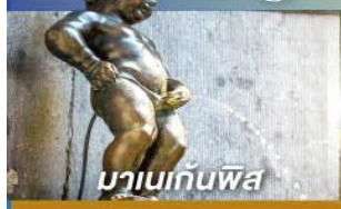
มานเนกั่นพิส