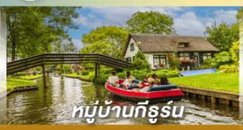
หมู่บ้านทึร์รูน