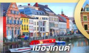
เมืองกันต์