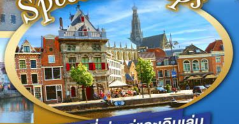
ชมเมืองที่เก่าแก่และเดินเล่น ย่านเมืองเก่าสุดคลาสสิก