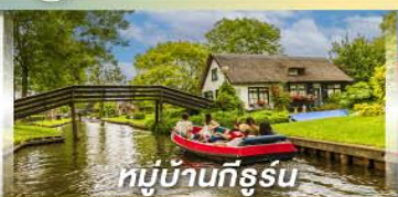
หมู่บ้านทึร์รูน