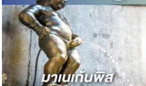
มานเนกันพิส