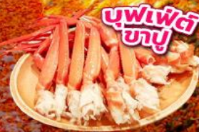
มิตซูเอะอิเกะ พาร์ค คิซะระซู