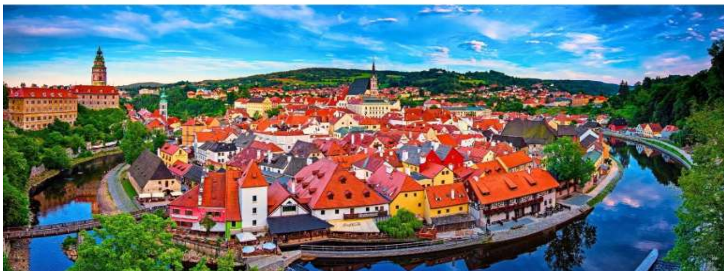
GG35 เซก ออสเตรีย สโลวาเกีย ซังการ์ 8 วัน 5 คืน

เที่ยง รับประทานอาหารกลางวัน ณ ภัตตาคารอาหารพื้นเมือง เมนูปลาเทร้ำย่างเกลือ (มื้อที่ 1)