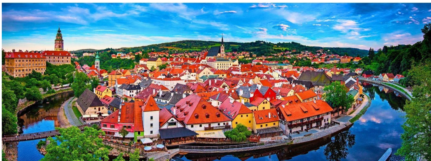
GG35 เซก ออสเตรีย สโลวาเกีย ซังการ์ 8 วัน 5 คืน

เที่ยง รับประทานอาหารกลางวัน ณ ภัตตาคารอาหารพื้นเมือง เมนูปลาเทร่าย่างเกลือ (มื้อที่ 1)