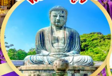
หลวงพ่อโต ไคบุคิ