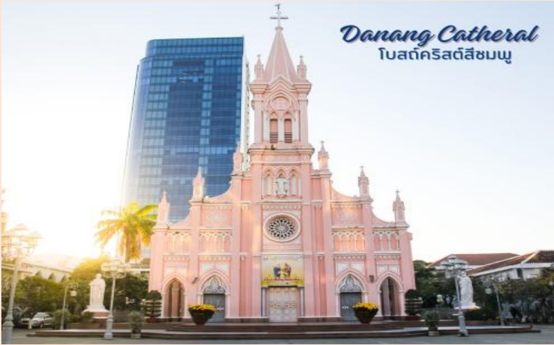
Danang Cathedral โบสถ์คริสต์ดานัง

นำท่านถ่ายรูป โบสถ์คริสต์ดานัง หรือโบสถ์คริสต์ลี ซมพู (Danang Cathedral) สร้างขึ้นสมัยเวียดนาม ตกเป็นอาณานิคมของฝรั่งเศส สถาปัตยกรรมสไตล์ โกธิก ยตกแต่งด้วยความประณีตสวยงาม ตัวโบสถ์ เป็นสีชมพูทั้งหลัง ตัดขอบด้วยสีขาว เป็นอีกหนึ่ง สถานที่ที่ไม่ควรต้องพลาดเมื่อมาเยือนเมืองดานัง จากนั้น อิสระช้อปปิ้ง ตลาดฮาน อิสระเลือกซื้อ สินค้าหลากหลายชนิด เช่นผ้า เหล้า บุหรี่ และของ กินต่างๆ เป็นตลาดสดและขายสินค้าพื้นเมืองของ เมืองดานัง