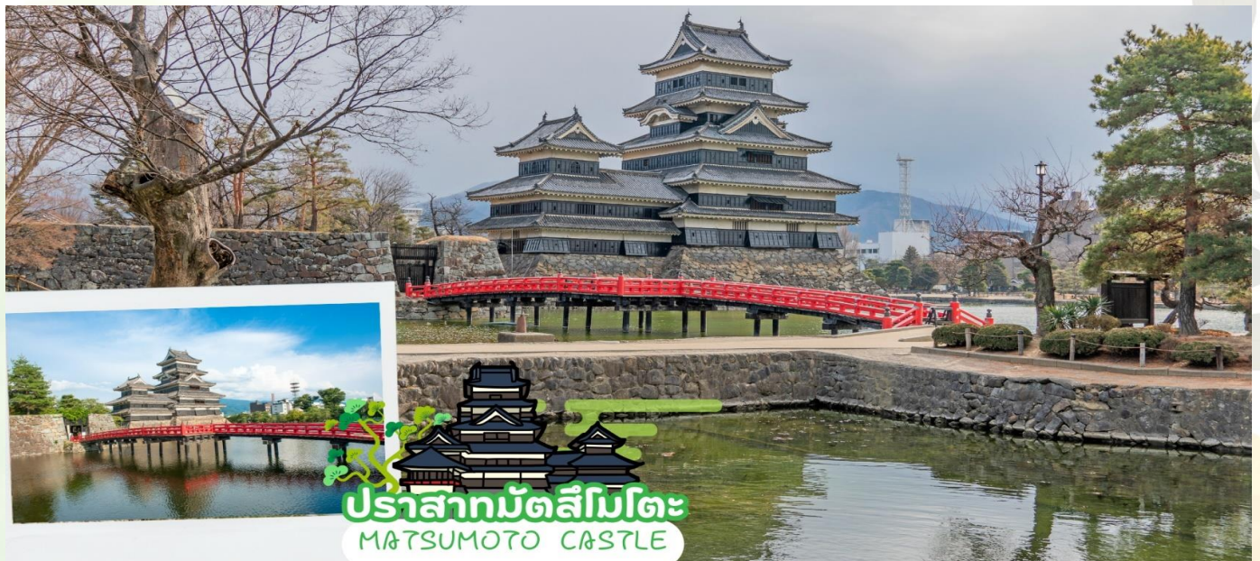
ปราสาทมัตสึโมโตะ MATSUMOTO CASTLE

นำท่านเดินทางสู่ เมืองมัตสึโมโตะ (Matsumoto) เมืองแห่งประวัติศาสตร์ ศิลปะ และมรดกทางวัฒนธรรม เป็นเมืองที่ใหญ่เป็นอันดับสองในจังหวัดนากาโนะ ซึ่งเมืองเคাঁตั้งอยู่ในหุบเขาทางใต้เทือกเขาที่สูงที่สุดของญี่ปุ่น หรือที่รู้จักกันดีในชื่อเทือกเขาแอลป์เหนือ