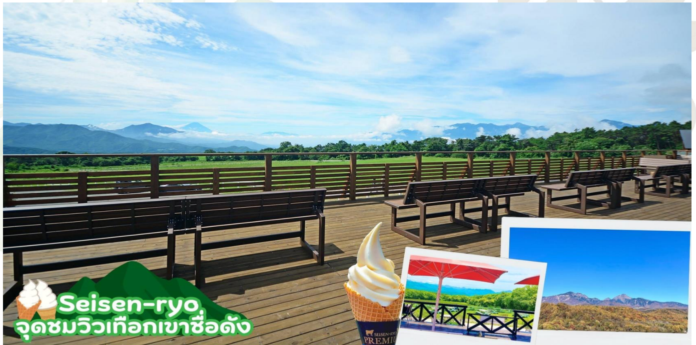
Seisen-ryo จุดชมวิวเทือกเขาชื่อดัง

นำท่านเดินทางสู่ เมืองมัตสึโมโตะ (Matsumoto) เมืองแห่งประวัติศาสตร์ ศิลปะ และมรดกทางวัฒนธรรม เป็นเมืองที่ใหญ่เป็นอันดับสองในจังหวัดนากาโนะ ซึ่งเมืองเคাঁตั้งอยู่ในหุบเขาทางใต้เทือกเขาที่สูงที่สุดของญี่ปุ่น หรือที่รู้จักกันดีในชื่อเทือกเขาแอลป์เหนือ