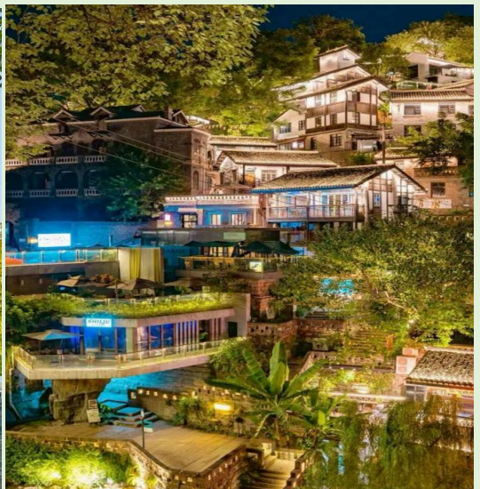
VCKG54FD-22 ฉงชิ่ง สาย ครบ จบในทริปเดียว 5วัน4คืน BY FD