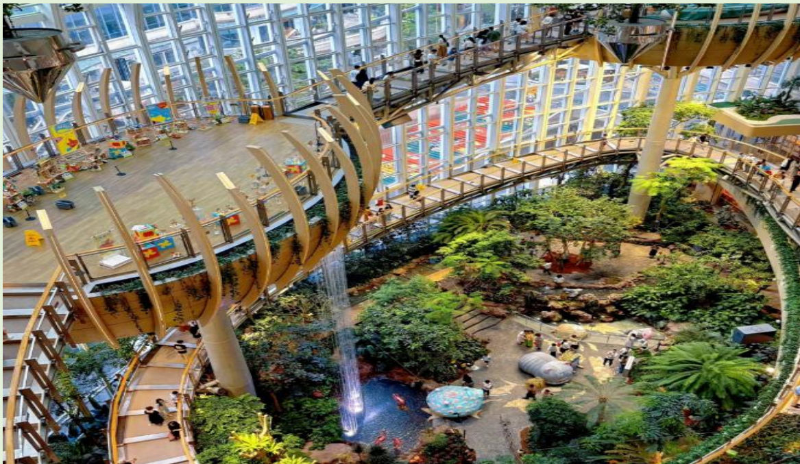
VCKG54FD-22 ฉงชิ่ง สาย ครบ จบในทริปเดียว 5วัน4คืน BY FD

นำท่าน ชมร้านหยก ที่มีความสวยงาม ให้ท่านได้เลือกชมเลือกซื้อสวมใส่เครื่องประดับได้ (ใช้เวลาประมาณ 60 - 90 นาที) นำท่านไปช้อปปิ้งตึกกันที่ The ring shopping mall ซึ่งห้าง The ring นี้ เป็นห้างสรรพสินค้าที่โดดเด่นด้วยการออกแบบให้มีสวนพฤกษศาสตร์ในร่มขนาดใหญ่ มีน้ำตกในร่มสูงกว่า 20 เมตร และมีต้นไม้กว่า 300 สายพันธุ์ นอกจากนี้ยังมีสถาปัตยกรรมภายนอกที่สวยงามเหมาะแก่การถ่ายรูป มุมยอดนิยมคือโดมสีขาวด้านหน้าห้าง ภายในห้างมีร้านค้าแบรนด์เนม ร้านอาหาร คาเฟ่ และโซนไลฟ์สไตล์