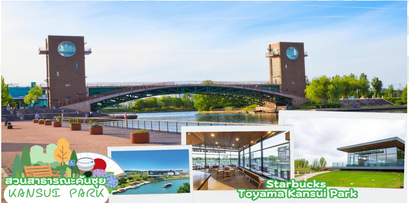
สวนสาธารณะคันซุย KANSHUI PARK