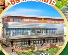
มีตชยุ เอาก้าเล็ก พาร์ค คาโดมะ