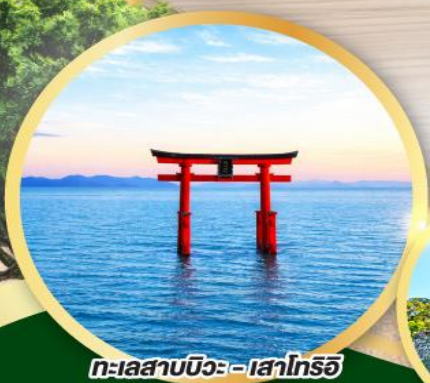
ทะเลสาบบิวะ - เส่าโทริอิ