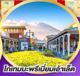
โทเทมโบะ-พรีเมียมเอ้าเล็ด

สนุกกับสวนสนุก FUJI-Q HIGHLAND พร้อมกับน้องหมีเนย BUTTERBEAT