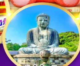
วัดโคโคคุอิน