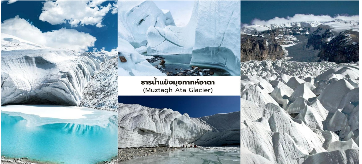
ธารน้ำแข็งมูซทากหืออาตา (Muztagh Ata Glacier)

จากนั้นนำท่านเดินทางต่อสู่ เมืองทาชเคอร์กาน (Tashkurgan) ระยะทางจากมูซทากหืออาตาประมาณ 50 กิโลเมตร ใช้เวลาเดินทางราว 1 ชั่วโมง อำเภอทาชเคอร์กานเป็นเมืองชายแดนที่ตั้งอยู่บนความสูงประมาณ 3,000 กว่าเมตรเหนือระดับน้ำทะเล ซึ่งเป็นเขตปกครองตนเองของชนเผ่าทาจิกและมีชาวทาจิกอาศัยอยู่เป็นประชากรส่วนใหญ่ของพื้นที่เมืองแห่งนี้ ด้วยความที่ตั้งอยู่ใกล้ชายแดนปากีสถาน ทาจิกิสถานและอัฟกานิสถานทำให้มีความสำคัญทั้งในด้านภูมิศาสตร์และวัฒนธรรมในอดีตพื้นที่แห่งนี้เคยเป็น จุดยุทธศาสตร์สำคัญบนเส้นทางสายไหม (Silk Road) ซึ่งใช้เป็นเส้นทางผ่านของพ่อค้าและนักเดินทางระหว่างจีนกับเอเชียกลาง ปัจจุบันแม้จะเป็นเมืองที่มีขนาดเล็ก แต่ก็ยังคงรักษาวัฒนธรรม วิถีชีวิตและเอกลักษณ์ของชนเผ่าทาจิกท่ามกลางภูมิประเทศของที่ราบสูงปามีร์ที่งดงามและเขียวสงบ เมืองทาชเคอร์กานจึงถือเป็นหนึ่งในเมืองชายแดนที่มีเอกลักษณ์ทางชาติพันธุ์และประวัติศาสตร์บนเส้นทางสายไหมที่สะท้อนถึงการผสมผสานของวัฒนธรรมจีนและเอเชียกลางได้อย่างน่าสนใจ.