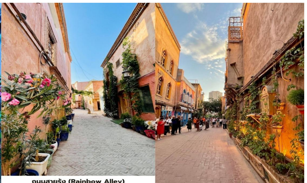
ถนนสายรุ้ง (Rainbow Alley)