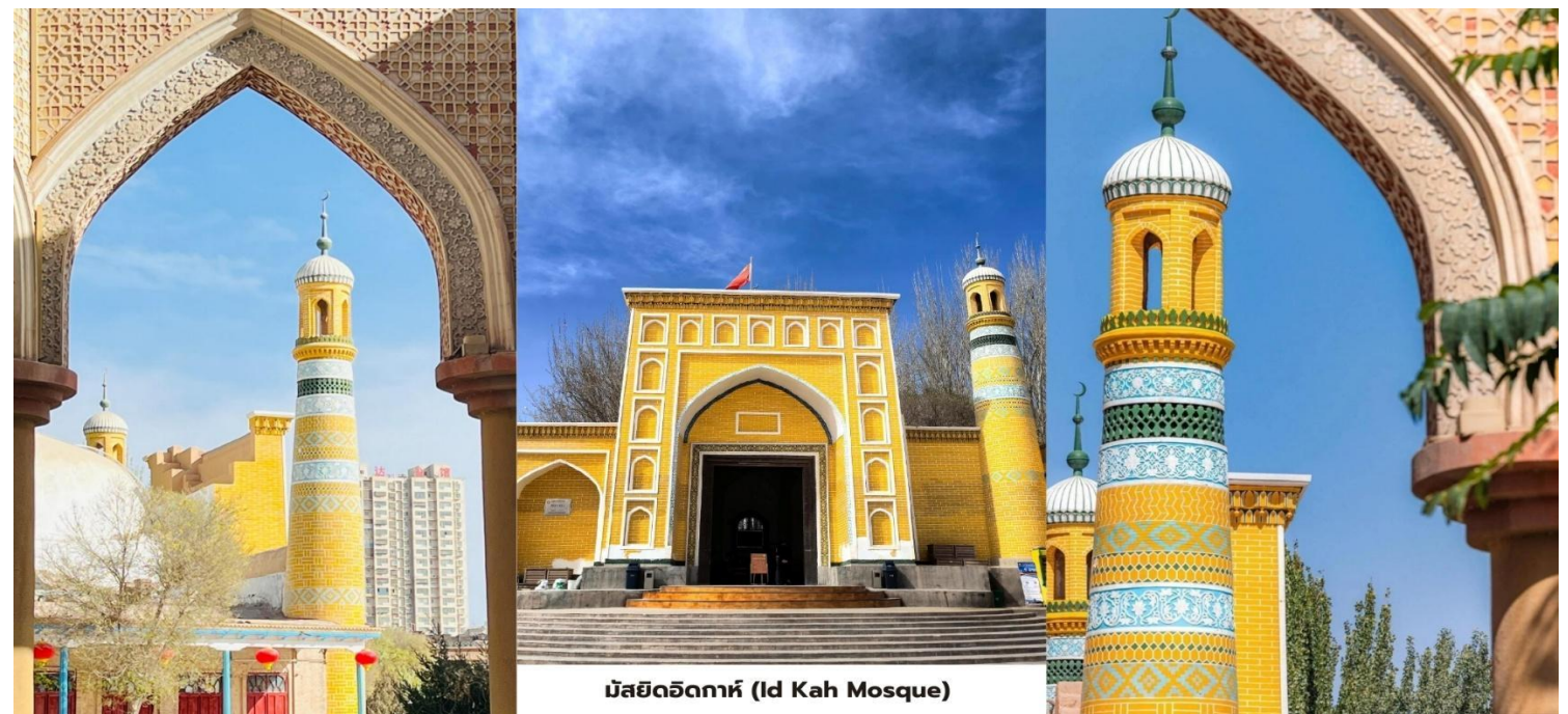
มัสยิดอิคคาห์ (Id Kah Mosque)

สมควรแก่เวลานำท่านเดินทางสู่ สนามบินคาสการ์ (Kashgar Airport) ปลายทางในประเทศกลับสู่ซินเจียง