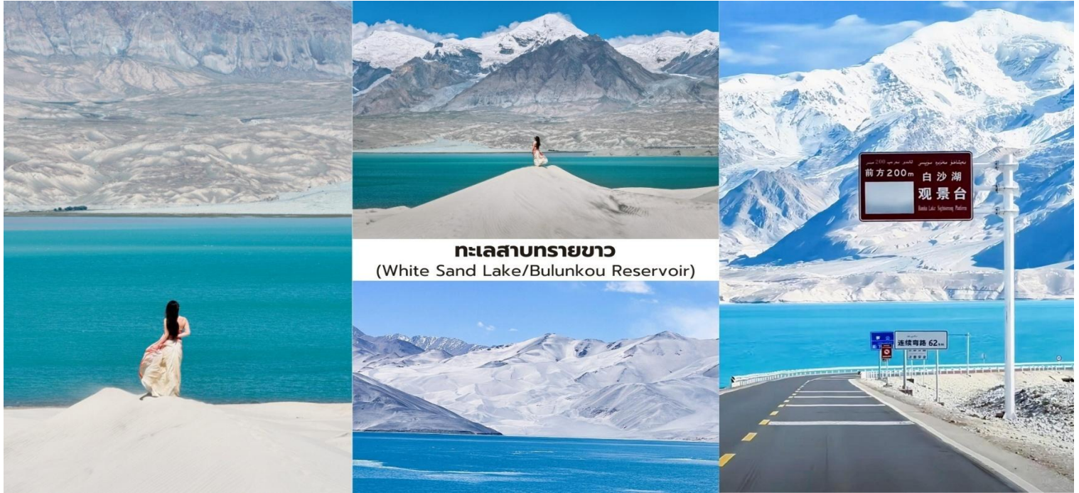
ทะเลสาบทรายขาว (White Sand Lake/Bulunkou Reservoir)

เป็นหนึ่งในจุดถ่ายภาพที่มีชื่อเสียงของเส้นทางสายปามิร์ ทิวทัศน์บริเวณนี้ยังมีฉากหลังเป็น ยอดเขาคองกูร์ (Kongur Tagh) สูง 7,719 เมตร ซึ่งช่วยเพิ่มความอลังการของภูมิประเทศและทำให้สถานที่แห่งนี้ ได้รับการขนานนามว่าเป็น “สวรรค์บนดินของจีนเจียง” ระยะทางจากทาชเคอร์กันประมาณ 130 กิโลเมตร ใช้เวลาเดินทางราว 2.5 ชั่วโมง ช่วงเช้าเป็นเวลาที่เหมาะสำหรับการถ่ายภาพ เนื่องจากแสงสวยและลมสงบ