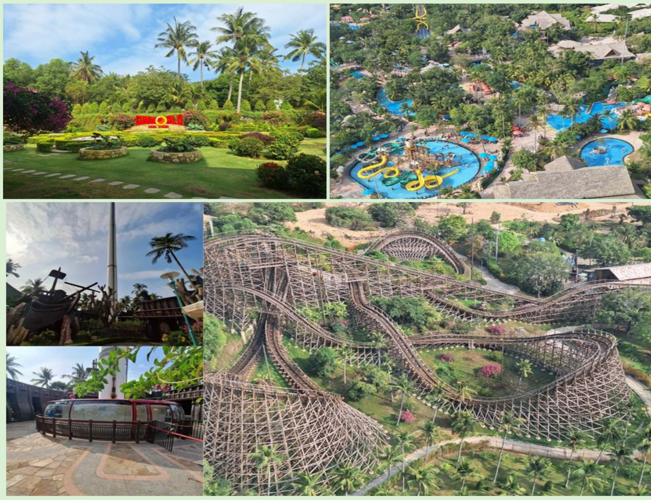
ได้เวลาอันสมควร นำท่านนั่งกระเช้ากลับฝั่งฟูกีว

SUN SET TOWN หรือ เมืองเมดิเตอร์เรเนียน (Mediterranean Town) สถาปัตยกรรมจำลองบ้านสไตล์ เมดิเตอร์เรเนียนหลากสีติดริมทะเล ตั้งอยู่บนเนินเขา จุดศูนย์กลางของเมืองคือหอนาฬิกาอิฐสีแดงสูงถึง 75 เมตร หันหน้าไปทางทะเล