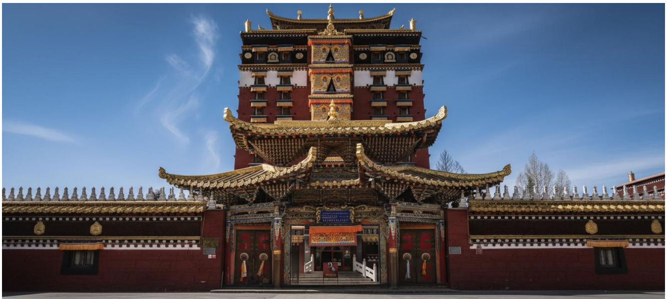
บ่าย นำท่านเดินทางสู่ หอฟพระมิลาระปะ (ระยะทาง 134 ก.ม. ใช้เวลาเดินทางประมาณ 2 ชั่วโมง) สู่ใจกลางศรัทธา หอพระ 9 ชั้น มิลาระปะ สถาปัตยกรรมทางพุทธศาสนาที่น่าอัศจรรย์ใจและเป็นหนึ่งเดียวใน

GO1LHW-MU003 เทียวคัม สองมณฑล กานหนานแดนฝัน จิวใจไกวสวรรค์สิศราม 8 วัน 6 คืน โดย สายการบินไชน่า อีสเทิร์น (MU)