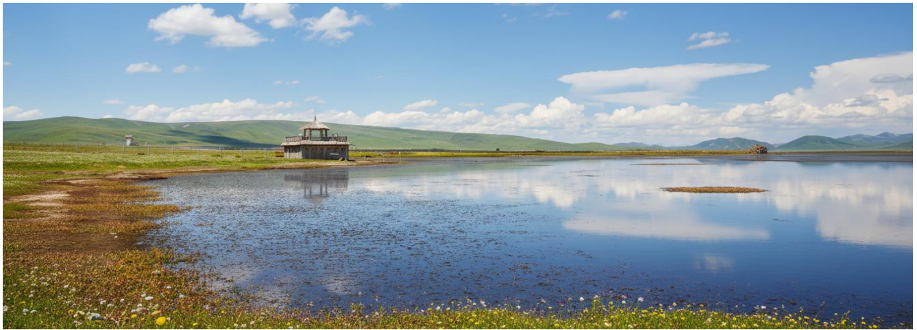
กลางวัน รับประทานอาหารกลางวัน ณ ภัตตาคาร (เมื่อที่ 17)

ขจี อากาศที่นี้บริสุทธิ์และบางเบา มีเพียงเสียงลมที่พัดผ่านยอดหญ้าและเสียงนกน้ำที่ขับขานเป็นท่วงทำนองแห่งธรรมชาติ บรรยากาศอันเจียบสงบจะชะล้างความเหนื่อยล้าให้หมดสิ้นไปในทันที ทะเลสาบแห่งนี้ไม่ได้เป็นเพียงความงดงามทางสายตา แต่ยังเป็นพื้นที่ชุ่มน้ำอันอุดมสมบูรณ์และมีความสำคัญยิ่งต่อระบบนิเวศบนที่ราบสูงทิเบต ถือเป็นแหล่งพักพิงและสวรรค์ของเหล่านกอพยพนานาชนิด โดยเฉพาะอย่างยิ่ง "นกกะเรียนคอดำ" สัตว์ปีกสง่างามอันเป็นสัญลักษณ์แห่งความสุขและอายุยืนยาวในวัฒนธรรมทิเบต ในช่วงฤดูร้อน ทิวทัศน์รอบทะเลสาบจะผลิดอกไม้ป่านานาพรรณ กลายเป็นภาพวาดสีสดใสที่ธรรมชาติรังสรรค์ขึ้น เชิญท่านทอดน่องไปตามสะพานไม้ที่ทอดยาวเหนือผืนน้ำ สูดอากาศอันแสนสดชื่นให้เต็มปอด พร้อมเก็บภาพความประทับใจของผืนน้ำจืดขอบฟ้า ที่ซึ่งฝูงปศุสัตว์ของชาวทิเบตพื้นเมืองกำลังเล็มหญ้าอย่างอิสระอยู่ไกลๆ