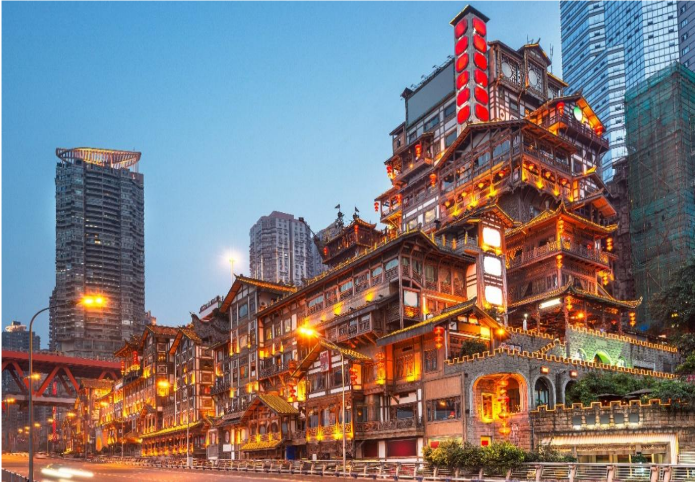
ค่ำ รับประทานอาหารค่ำ ณ ภัตตาคาร (มื้อที่ 4) เมนูพิเศษ สุกี้ชาบู หม่าล่า

จากนั้นนำท่านสู่ หงหยาดัง คอมเพล็กซ์ในรูปแบบทรงอาคารโบราณขนาดใหญ่ ภายในมีร้านค้า ร้านอาหาร ร้านขายสินค้าที่ระลึก ฯลฯ ที่นี่ถือเป็นจุดนัดพบพักผ่อนของชาวเมือง และจุดชมวิวชั้นดี อีกทั้งยังเป็นจุดถ่ายรูปที่สำคัญของนักท่องเที่ยวอีกด้วย