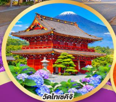
วัดโทเซคิจิ