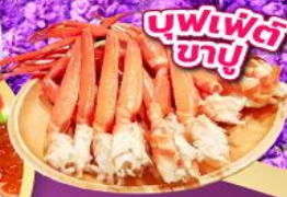
บุฟเฟ่ต์ ชาบู