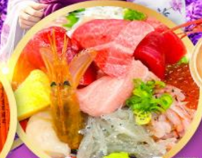
ตลาดปลาฮิมสุ คาชิโมะอิชิ