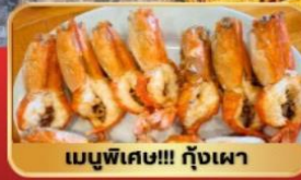
เมนูพิเศษ!!! กุ้งเผา