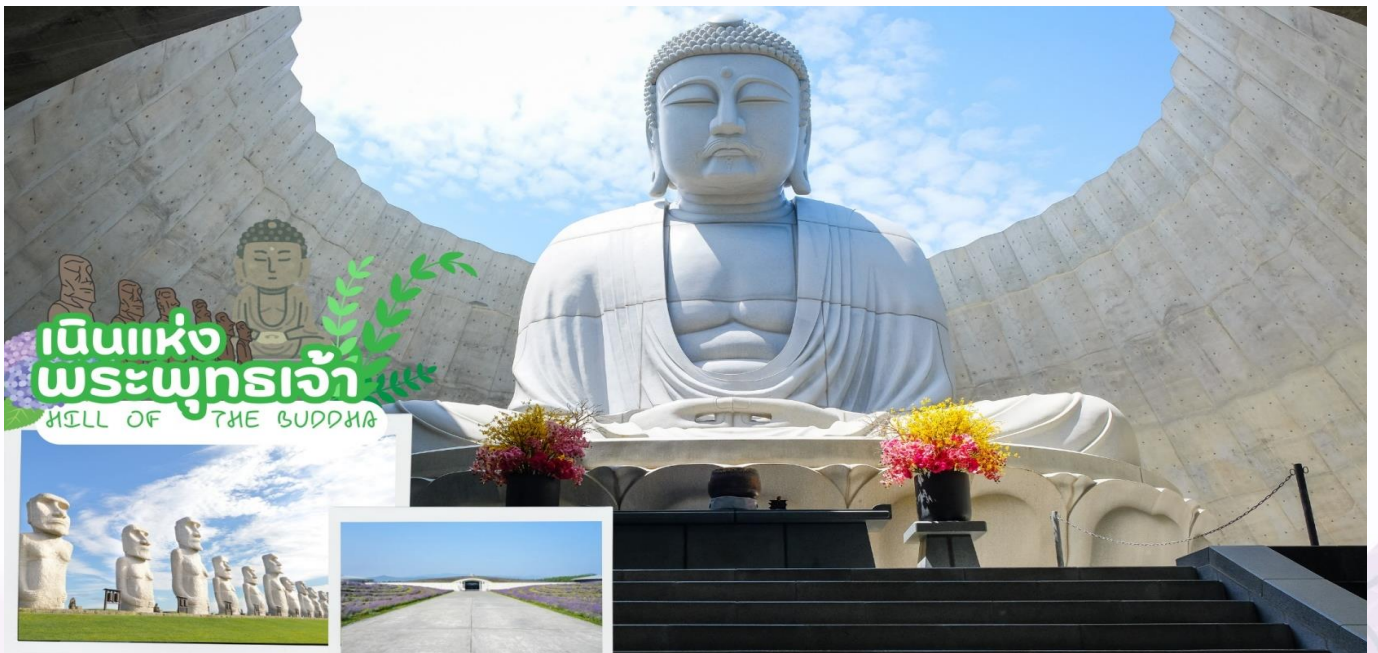
เนินแห่งพระพุทธรเจ้า HILL OF THE BUDDHA

นำท่านเดินทางสู่ เนินแห่งพระพุทธรเจ้า หรือ Hill of the Buddha ตั้งอยู่ทางตอนเหนือของเมืองซัปโปโร ที่ถูกออกแบบโดย Mr.Tadao ando สถาปนิกชื่อดังชาวญี่ปุ่น พระพุทธรูปมีความสูงถึง 13.5 เมตร และมีน้ำหนักมากถึง 1500 ตัน ล้อมรอบด้วยธรรมชาติที่สวยงามแตกต่างกันออกไปในแต่ละฤดู ฤดูหนาวก็จะรู้สึกได้ถึงความงดงามของหิมะที่ขาวโพลน นับได้ว่าเป็นอีกหนึ่งสถานที่ๆเรียกได้ว่าเป็น Unseen Hokkaido เลยทีเดียว จากนั้นนำท่านชม โมอายแห่งเมืองฮอกไกโด หรือที่เรียกว่า (makomanai takino reien) สร้างขึ้นในปี 1982 มีเนื้อที่ทั้งหมด 1,800,473 ตารางเมตร ด้านในมีรูปปั้นหินโมอายขนาดใหญ่ตั้งตระหง่านเรียงรายอยู่จำนวนมาก