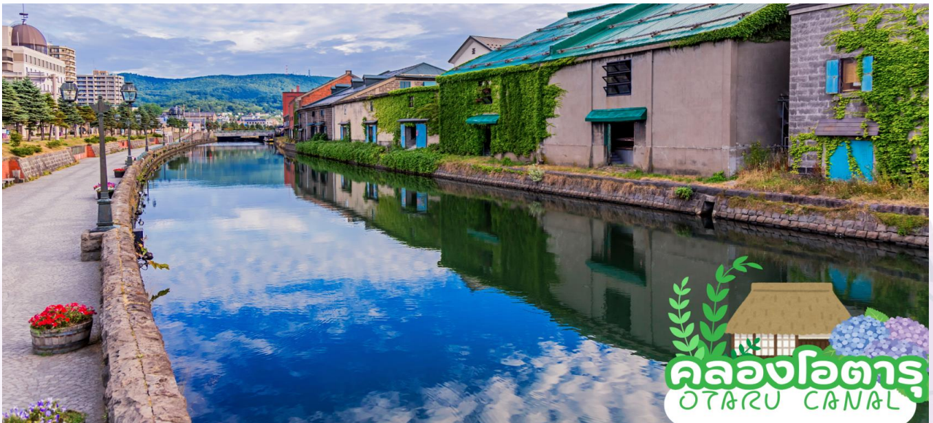
คลองโอตารุ OTARU CANAL

นำท่านเดินทางสู่ เมืองโอตารุ (Otaru) เมืองท่าที่มีความสำคัญและเก่าแก่ทางตะวันตกของฮอกไกโดที่มีเสน่ห์ด้วยบรรยากาศย้อนยุคและสุดแสนโรแมนติก