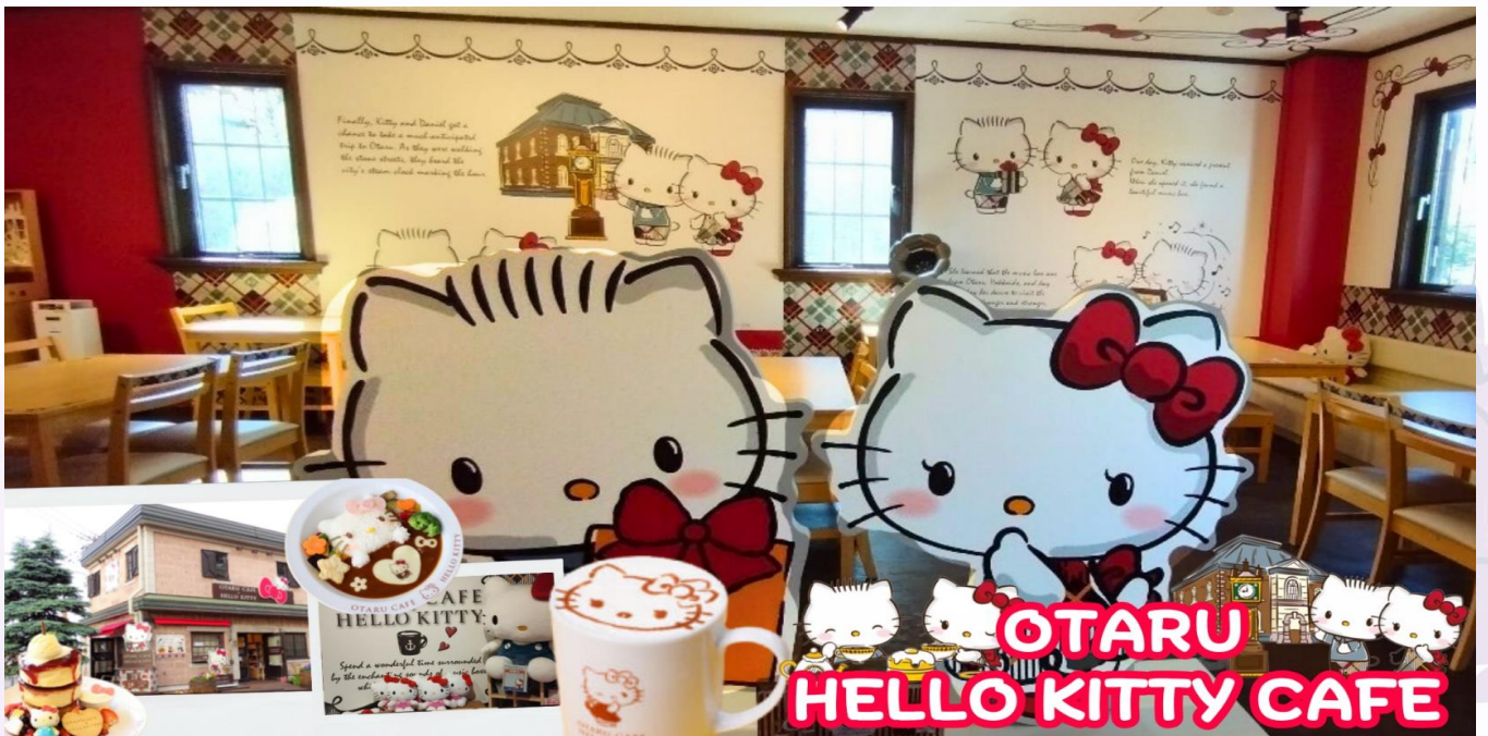
ร้านกาแฟ ฮัลโหล คิตตี้ เพลิดเพลินกับบรรยากาศน่ารัก ๆ ของตัวการ์ตูนแมวชื่อดัง คิตตี้ ให้ท่านได้เลือกซื้อสินค้าและถ่ายรูปตามอัธยาศัย