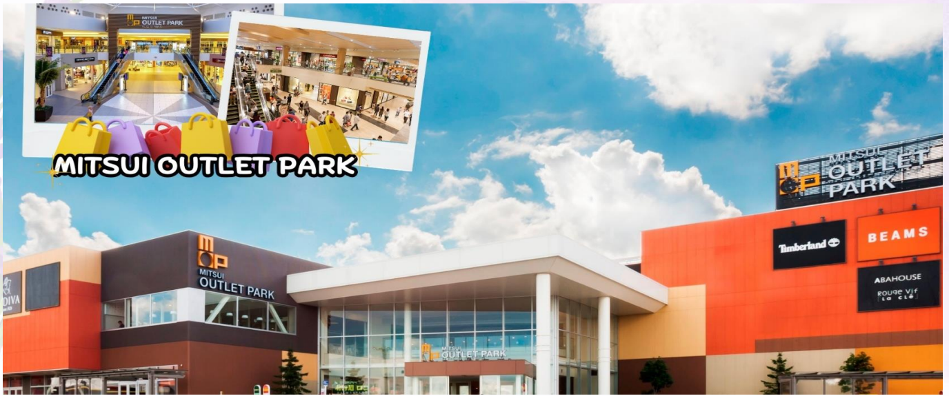
กลางวัน อีสรระอาหารกลางวันตามอัยาศัย ณ MITSUI OUTLET PARK SAPPORO