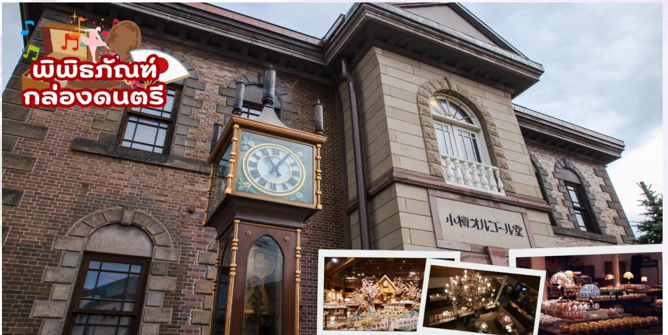
พิพิธภัณฑ์กล่องดนตรี อาคารเก่าแก่สองชั้นที่ภายนอกถูกสร้างขึ้นจากอิฐแดง แต่โครงสร้างภายในทำด้วยไม้ พิพิธภัณฑ์แห่งนี้สร้างขึ้นในปี 1910 ปัจจุบันนับเป็นมรดกทางสถาปัตยกรรมที่เก่าแก่และควรค่าแก่การอนุรักษ์ให้เป็นสมบัติของชาติ