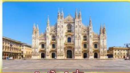
ซอปปิงจุใจที่มิลาน