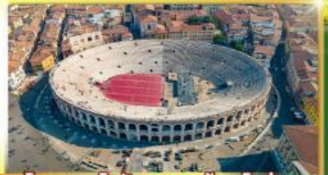
โรงละครโรมันกลางเมืองโรม