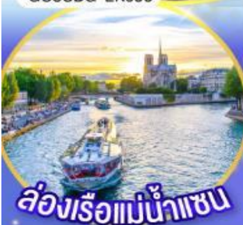
ล่องเรือแม่น้ำเซน