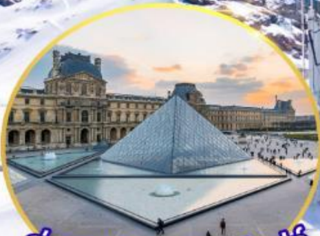
ถ่ายรูปพิพิธภัณฑ์ลูฟว์ GO3CDG-EK056