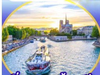
ล่องเรือแม่น้ำแอม