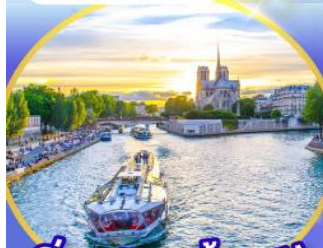
ล่องเรือแม่น้ำแอม