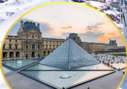
ถ่ายรูปพิพิธภัณฑ์ลูฟร์ GO3CDG-EK056