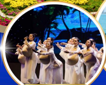
Charming Danang Show