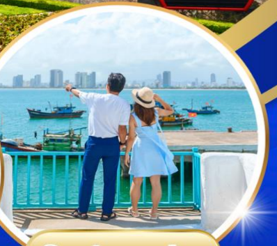
Son tra marina