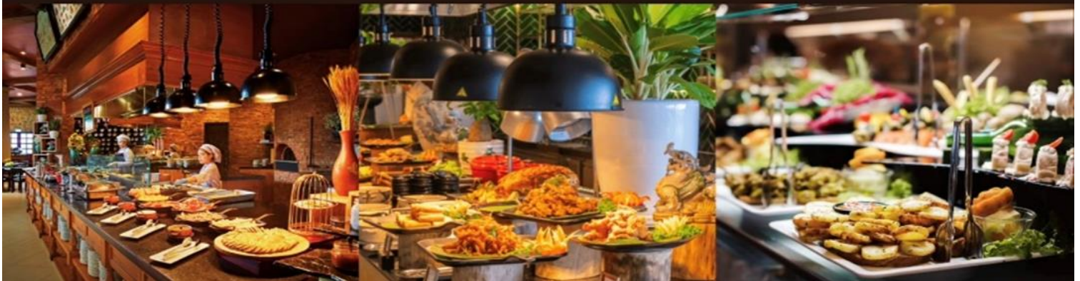
หน้า 5 (ภาพใช้เพื่อการโฆษณาเท่านั้น)

สำหรับท่านต้องการซื้ออาหารกลางวัน แบบบุฟเฟ่ต์นานาชาติด้านบนบาน่าฮิลล์เพิ่มเติม **ค่าอาหาร BUFFET ประมาณ 600 บาท / ท่าน**