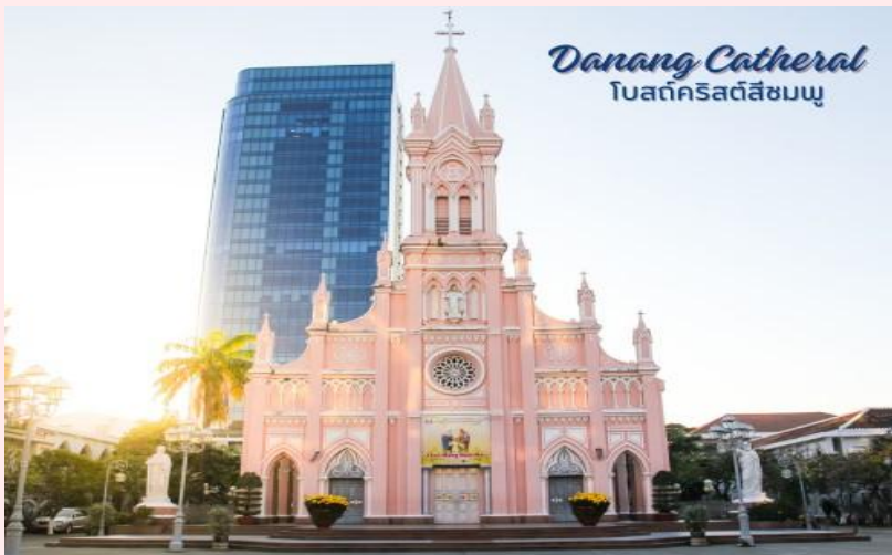
Danang Cathedral โบสถ์คริสต์สีชมพู

นำท่านถ่ายรูป โบสถ์คริสต์ดานัง หรือโบสถ์คริสต์สีชมพู (Danang Cathedral) สร้างขึ้นสมัยเวียดนาม ตกเป็นอาณานิคมของฝรั่งเศส สถาปัตยกรรมสไตล์โกธิก ยตกแต่งด้วยความประณีตสวยงาม ตัวโบสถ์เป็นสีชมพูทั้งหลัง ตัดขอบด้วยสีขาว เป็นอีกหนึ่งสถานที่ที่ไม่ควรต้องพลาดเมื่อมาเยือนเมืองดานัง จากนั้น อิสระช้อปปิ้ง ตลาดฮาน อิสระเลือกซื้อสินค้าหลากหลายชนิด เช่นผ้า เหล้า บุหรี่ และของกินต่างๆ เป็นตลาดสดและขายสินค้าพื้นเมืองของเมืองดานัง