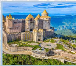
ปราสาทจันทร์