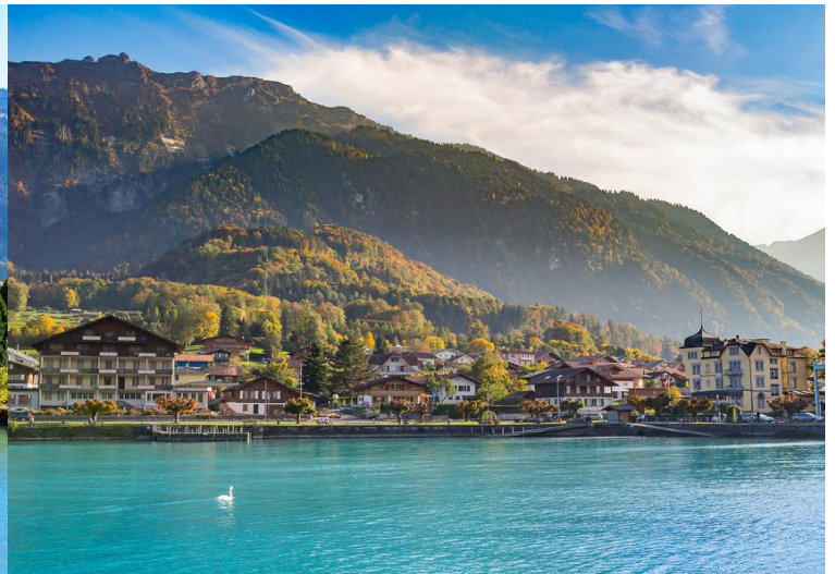
GO3MXP-EK035 update 31 Mar 2026