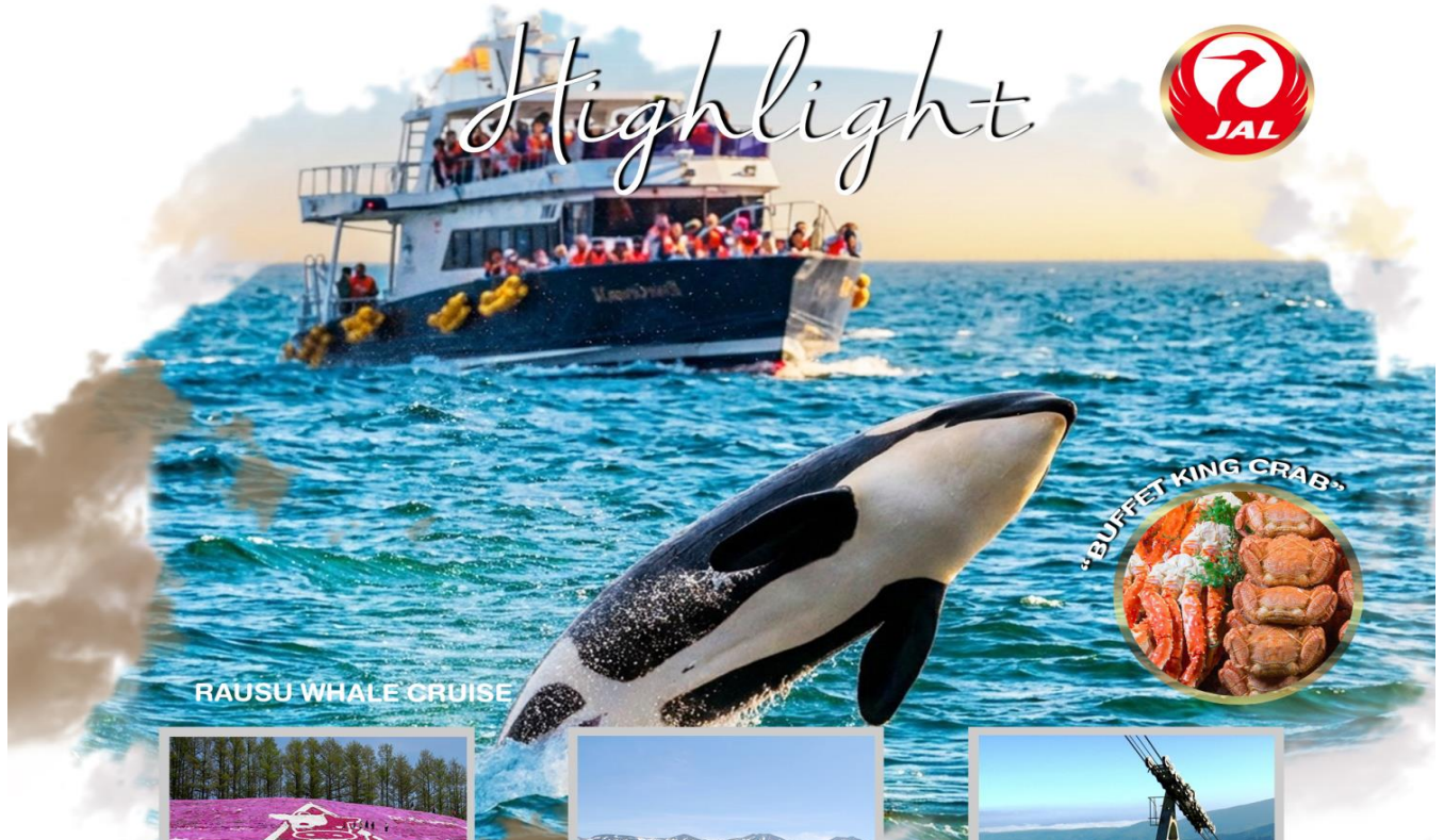
RAUSU WHALE CRUISE