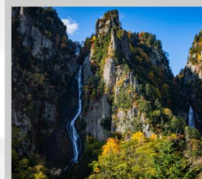
“GINGA & RYUSEI FALLS”

ต้นตอ “ทุ่งดอกพืชมอส ณ สวนดอกชิบะซาคุระฮิงะชิโมะโคะโตะ” ด้วยพรมสีชมพูที่มีพื้นที่ขนาดใหญ่ถึง 100,000 ตารางเมตร ชม “ทะเลสาบคาบสมุทรชิเรโตโก” เกิดมาจากการระเบิดของภูเขาไฟโอโอะและน้ำพุใต้ดิน จนเกิดเป็นทะเลสาบทั้ง 5 ของชิเรโตโก “ฟาร์มสุนัขจิ้งจอกฮอกไกโด” ฟาร์มสุนัขจิ้งจอกแห่งเดียวของเกาะฮอกไกโด สายพันธุ์ท้องถิ่นคือ สายพันธุ์ Ezo red fox เพลิดเพลินกับ “เนินสี่ฤดู” เนินเขากว้างใหญ่ที่มีดอกไม้บานนานาพันธุ์นับ 30 ชนิดปลูกเรียงรายสลับสีกันเป็นแนวยาว นำท่าน “นั่งกระเช้าภูเขาคุโรคะกะ” เชื่อมจากเชิงเขาของเมืองโซฮุนเคียวถึงยอดเขาคุโรคะกะที่มีความสูงถึง 670 เมตร ไฮไลท์ “ล่องเรือราอุสึ ชมความงามของวาฬเพชฌฆาต” บริเวณคาบสมุทรชิเรโตโก มรดกโลกทางธรรมชาติของฮอกไกโด