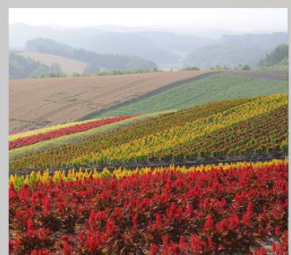
“SHIKISAI NO OKA”