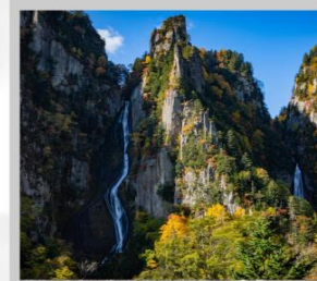
“GINGA & RYUSEI FALLS”

สัมผัสความสวยงามของดอกไม้ “ดอกทิวลิป ณ สวนคะมิยูเบทสึ” ที่มีมากกว่า 120 สายพันธุ์ เพลิดเพลินกับ “ถ้ำน้ำแข็งไอซ์ พาร์เจเลียน” ที่มีหยดน้ำแข็งรูปร่างสวยงามต่างๆ ที่อุณหภูมิ -20 องศา “ฟาร์มสุนัขจิ้งจอกฮอกไกโด” ฟาร์มสุนัขจิ้งจอกแห่งเดียวของเกาะฮอกไกโด สายพันธุ์ท้องถิ่นคือ สายพันธุ์ Ezo red fox ชมกระท่อมไม้หลังน้อยในดินแดนเทพนิยาย ณ “หมู่บ้านนิงเกิ้ลเทอร์เรซ” จำหน่ายสินค้าจำพวกงานฝีมือต่างๆ นำท่านขึ้นชมวิวมุมสูง “นั่งกระเช้าภูเขาไฟโมอิวะ” เพื่อชมทัศนียภาพของเมืองซัปโปโรจากมุมสูง ชม “ทุ่งดอกพืชมอส ณ สวนทาคิโนะอุเอะ” ด้วยพรมสีเขียวที่มีพื้นที่ขนาดใหญ่ถึง 100,000 ตารางเมตร