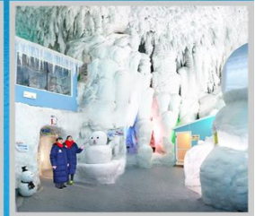
"KAMIKAWA ICE PAVILLION"