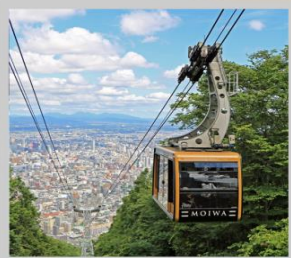
“MT. MOIWA ROPEWAY”