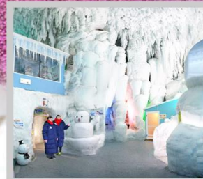
“KAMIKAWA ICE PAVILLION”