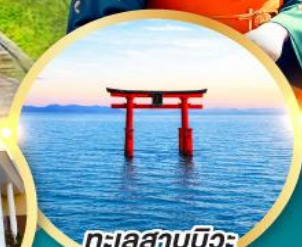
ทะเลสาบบิวะ เสาโทริอิ

เส้นทางสายอัลไพน์ทากายามา กำแพงหิมะ เขื่อนคุโรเบะ