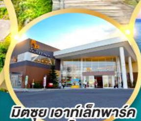
มิตซูโฮะที่ลีกพาร์ค คาโดมะ