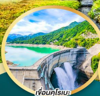
เขื่อนคุโรเบะ