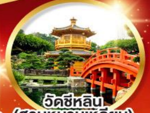
วัดซีหลิน (สวนหนานเหลียน)