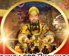
วัดแซกง 600ปีหุยนหลง