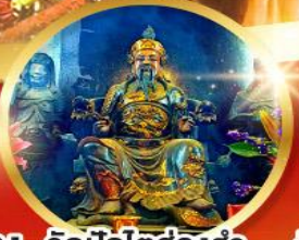
วัดปักไคฮองอำ