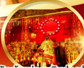
วัดเจ้าแม่กวนอิมฮองอำ