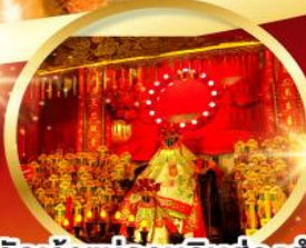
วัดเจ้าแม่กวนอิมฮองอ่า