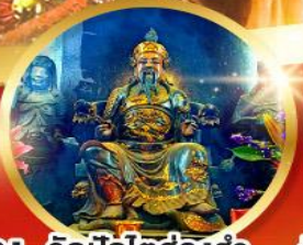
วัดปักไคฮองอ่า