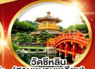
วัดซีหลิน (สวนหนานเหลียน)