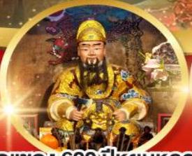
วัดเซกง 600 ปี หุ่นหลอง