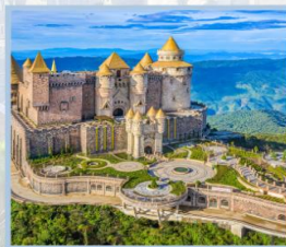
ปราสาทจันตรา