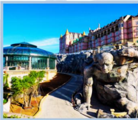
โซน Eclipse Square