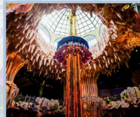
สวนสนุก Fantasy Park