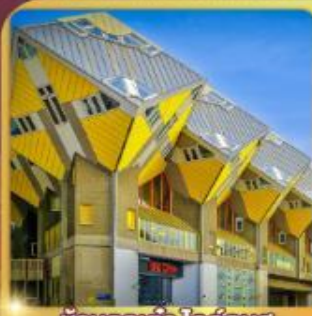
บ้านลูกเต่า โคกคูนุส

“ล่องเรือหลังคากระจก” ชมกรุงอัมสเตอร์ดัม