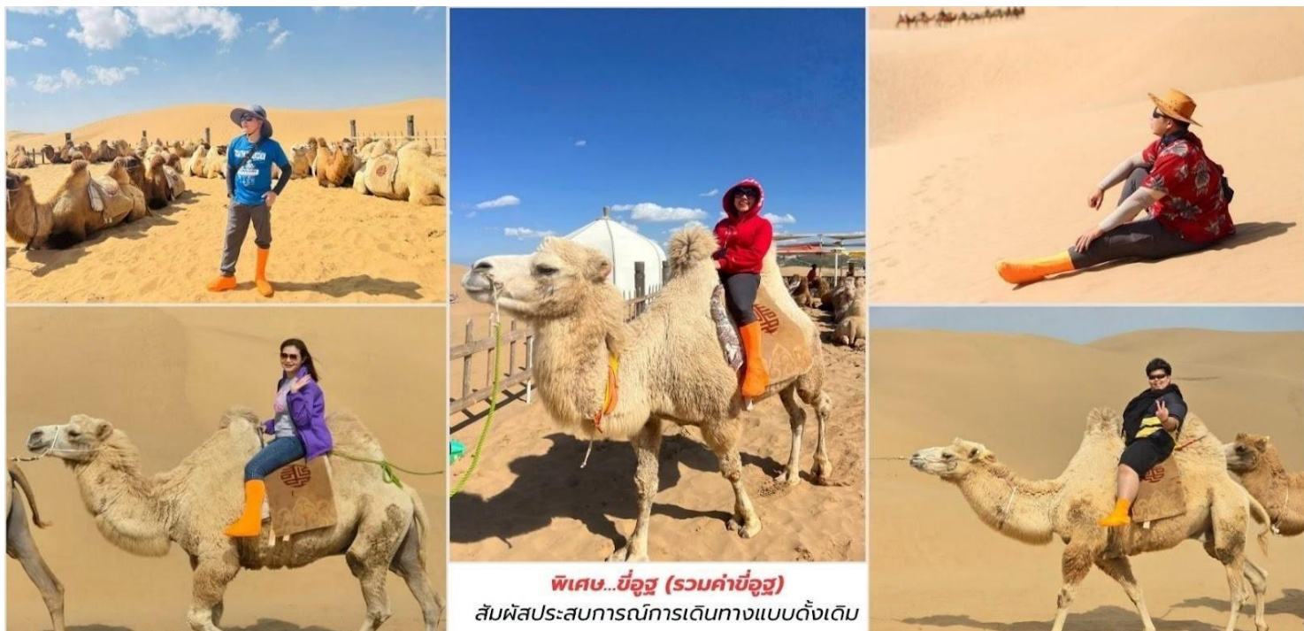
พิเศษ...ขี่อูฐ (รวมค่าขี่อูฐ) สัมผัสประสบการณ์การเดินทางแบบดั้งเดิม

พิเศษ... นำท่าน ขี่อูฐ สัมผัสประสบการณ์การเดินทางแบบดั้งเดิม ของชาวทะเลทราย นั่งบนหลังอูฐ เดินไปตามเนินทราย ชมวิวทะเลทรายอันกว้างใหญ่สุดลูกหูลูกตา