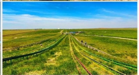
OPTION TOUR.. กิจกรรมทุ่งหญ้าออร์ดอส (Ordos Prairie)

OPTION TOUR ท่านสามารถเลือกซื้อบริการเพิ่ม ราคา 380 หยวน ต่อท่าน สามารถเลือกกิจกรรมอื่นๆที่น่าสนใจ ได้ 12 รายการดังนี้