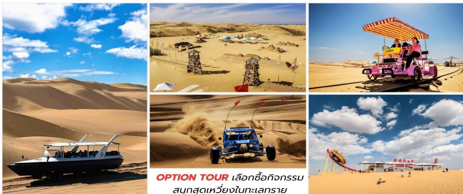
OPTION TOUR เลือกซื้อกิจกรรม สนุกสุดเหวี่ยงในทะเลทราย

จากนั้นท่าน สามารถเลือกซื้อกิจกรรมเสริมเล่นบนทะเลทรายได้ดังนี้