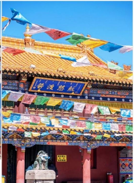
วัดต้าเจา (Dazhao Temple)