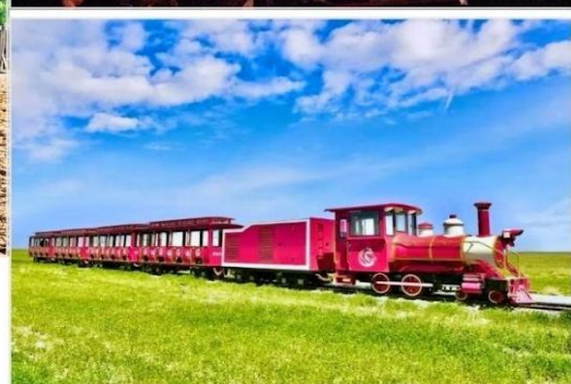
OPTION TOUR.. กิจกรรมทุ่งหญ้าออร์ดอส (Ordos Prairie)