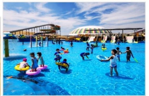
OPTION TOUR เลือกซื้อกิจกรรม สนุกสุดเหวี่ยงในทะเลทราย