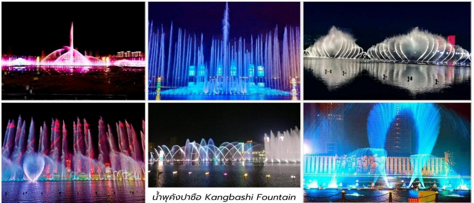
น้ำพุคังปาซื่อ Kangbashi Fountain

นำท่านชม น้ำพุคังปาซื่อ (Kangbashi Fountain, 康巴什喷泉广场)* สัญลักษณ์สำคัญของเมืองใหม่คังปาซื่อ แต่ยังคงได้รับการกล่าวขานว่าเป็นหนึ่งในน้ำพุที่สูงและยิ่งใหญ่ที่สุดในเอเชีย สามารถพ่นน้ำได้สูงถึง 230 เมตร ระบายน้ำพุคังปาซื่อไม่ใช่แค่น้ำพุธรรมดา แต่เป็นการแสดงที่ผสมผสานระหว่างการเคลื่อนไหวของสายน้ำ