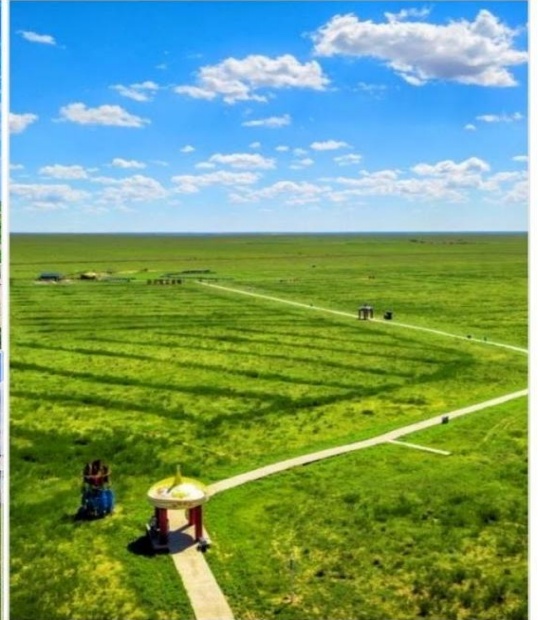
ทุ่งหญ้าออร์ดอส (Ordos Prairie)

บ่าย นำท่านชม ทุ่งหญ้าออร์ดอส (Ordos Prairie, 鄂尔多斯草原) เสน่ห์แห่งมองโกเลียในแหล่งธรรมชาติอันงดงาม ที่ซึ่งท้องฟ้ากว้างใหญ่ทอดยาวเหนือพรมแดนแห่งทุ่งหญ้าเขียวขจีตลอดสาย ผืนฟ้าใบธรรมชาติขนาดใหญ่ที่รอให้คุณมาสัมผัสความงดงามและเสน่ห์อันบริสุทธิ์ ทุ่งหญ้าออร์ดอส ไม่ได้เป็นเพียงแค่พื้นที่กว้างใหญ่ แต่ยังเป็นศูนย์รวมของวัฒนธรรมและประวัติศาสตร์อันยาวนานของชาวมองโกเลีย ที่นี้คุณจะได้เห็น กระจอมเกอร์ (Ger หรือ Yurt) ตั้งเรียงรายอยู่บนเนินหญ้า ตัดกับท้องฟ้าสีคราม และฝูงสัตว์ที่เล็มหญ้าอย่างสงบ นี่คือภาพจำลองชีวิตที่ยังคงรักษาไว้ซึ่งความเรียบง่ายและเป็นอิสระ ทุ่งหญ้าออร์ดอสเป็นสวรรค์ของช่างภาพ ด้วยทิวทัศน์อันกว้างใหญ่ แสงยามเช้าและยามเย็นที่งดงาม และวิถีชีวิตที่น่าสนใจ