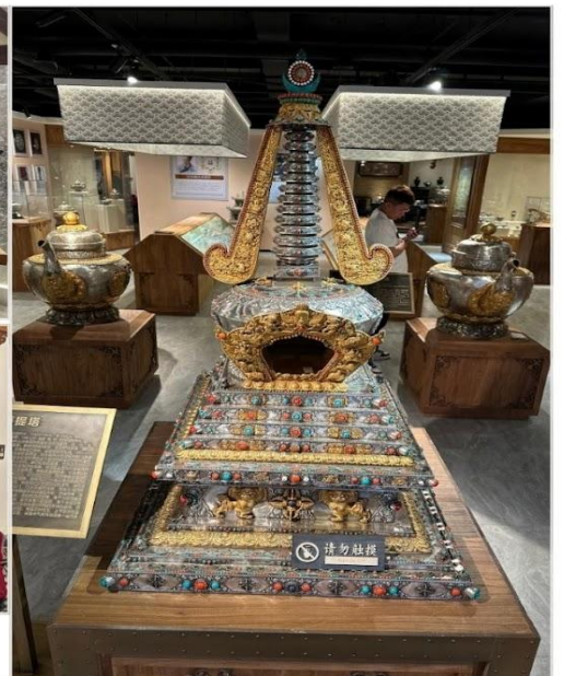
ร้านเครื่องเงินมองโกล