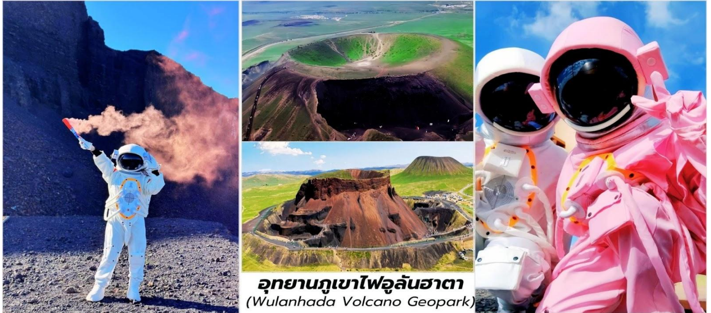
อุทยานภูเขาไฟอูลันฮาตา (Wulanhada Volcano Geopark)

นำท่านชม ภูเขาไฟหมายเลข 6 เป็นภูเขาไฟที่มีลักษณะสีดำเข้มจากหินภูเขาไฟที่ถูกขุดออกไปค่อนข้างมาก ทำให้ดูคล้ายกับพื้นผิวของดวงจันทร์หรือดาวอังคารอย่างชัดเจน ที่นี่เป็นจุดยอดนิยมสำหรับการถ่ายภาพ โดยเฉพาะอย่างยิ่งกับการเช่า พิเศษ...สวมชุดนักบินอวกาศ (รวมค่าชุดแล้ว) ใสเพื่อสร้างบรรยากาศ "การสำรวจอวกาศ"