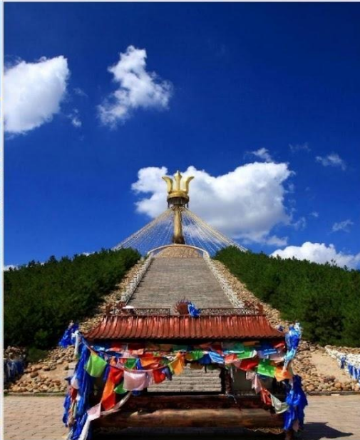
อี้เค่อโอบุ (Great Oboo, 伊克敖包)