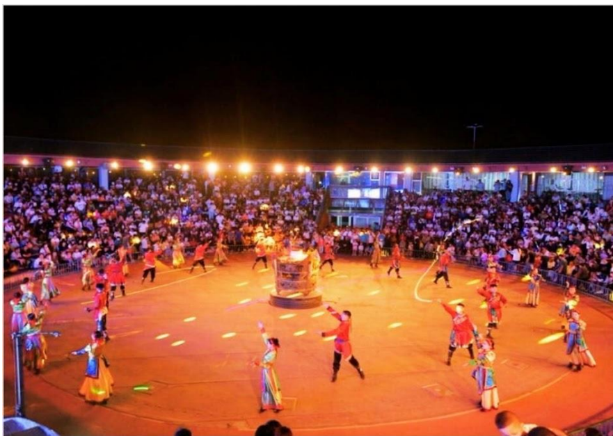
งานราตรีรอบกองไฟมองโกล

คำ บริการอาหารค่ำ ณ ภัตตาคาร พิเศษ สุกี่มองโกล ที่พัก MONGOLIC YURT หรือเทียบเท่า ที่พักรีสอร์ทมองโกล สุดยอดประสบการณ์ที่คุณไม่ควรพลาด การพักผ่อน ท่ามกลางความงดงามอันกว้างใหญ่ของทุ่งหญ้าแห่งมองโกเลียใน