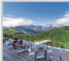
“HAKUBA MOUNTAIN HARBOR”

นำท่านไปโอบกอดธรรมชาติที่ครบครันในที่เดียว “คามิโคจิ” สวิสเซอร์แลนด์แดนญี่ปุ่นเทือกเขาที่ปกคลุมด้วยหิมะสวยงาม ชมความงามของ “ทุ่งพืชมอส ฟุจิชิบะซากุระ” มนต์เสน่ห์..พรมธรรมชาติสีชมพูหลากสีสดใส เปลี่ยนอิริยาบถ “จันทระเข้าฮาคุบะ อิวะตะกะ” เพื่อชมวิวพาโนรามาของเทือกเขาแอลป์ญี่ปุ่นกันให้อิ่มใจ สัมผัสกลิ่นอายเมืองเก่า “เมืองทาคายามา” ที่ยังคงอนุรักษ์ความเป็นอยู่ เมื่อสมัยเอโดะกว่า 300 ปี สายช้อปปิ้งห้ามพลาด “คารุอิซาวะ เอ้าท์เล็ต” แลนด์มาร์กของเมืองคารุอิซาวะ และ “ย่านชินจูกุ” แห่งเมืองโตเกียว ชมความงามกับเส้นทาง “เจแปนแอลป์ (ท่าแพงหิมะ)” สุดยอดของการท่องเที่ยวที่ถูกขนานนามว่า “หลังคาแห่งญี่ปุ่น”