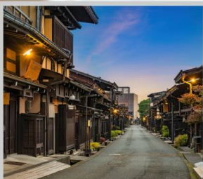
“TAKAYAMA OLD TOWN”