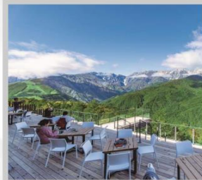
“HAKUBA MOUNTAIN HARBOR”

นำท่านไปโอบกอดธรรมชาติที่ครบครันในที่เดียว “คามิโคจิ” สวิสเซอร์แลนด์แดนญี่ปุ่นเทือกเขาที่ปกคลุมด้วยหิมะสวยงาม ชมความงามของ “ทุ่งพืชมอส ฟุจิชิบะซากุระ” มนต์เสน่ห์..พระธรรมชาติสีชมพูหลากสีสดใส เปลี่ยนอิริยาบถ “จันทระเข้าฮาคุบะ อิวะตะกะ” เพื่อชมวิวพาโนรามาของเทือกเขาแอลป์ญี่ปุ่นกันให้อิ่มใจ สัมผัสกลิ่นอายเมืองเก่า “เมืองทาคายาม่า” ที่ยังคงอนุรักษ์ความเป็นอยู่ เมื่อสมัยเอโดะกว่า 300 ปี สายช้อปปิ้งห้ามพลาด “คารุอิซาวะ เอ้าท์เล็ต” แลนด์มาร์กของเมืองคารุอิซาวะ และ “ย่านชินจุกุ” แห่งเมืองโตเกียว ชมความงามกับเส้นทาง “เจแปนแอลป์ (ท่าแพงหิมะ)” สุดยอดของการท่องเที่ยวที่ถูกขนานนามว่า “หลังคาแห่งญี่ปุ่น”