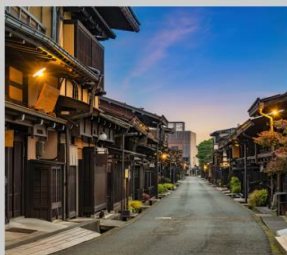
“TAKAYAMA OLD TOWN”