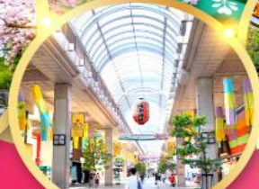
ช้อปปิ้ง ถนนอิชิบังโจ