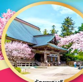
วัดชูซอนจิ