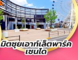
มิตซูเอากะเลียตพาร์ค เซนได