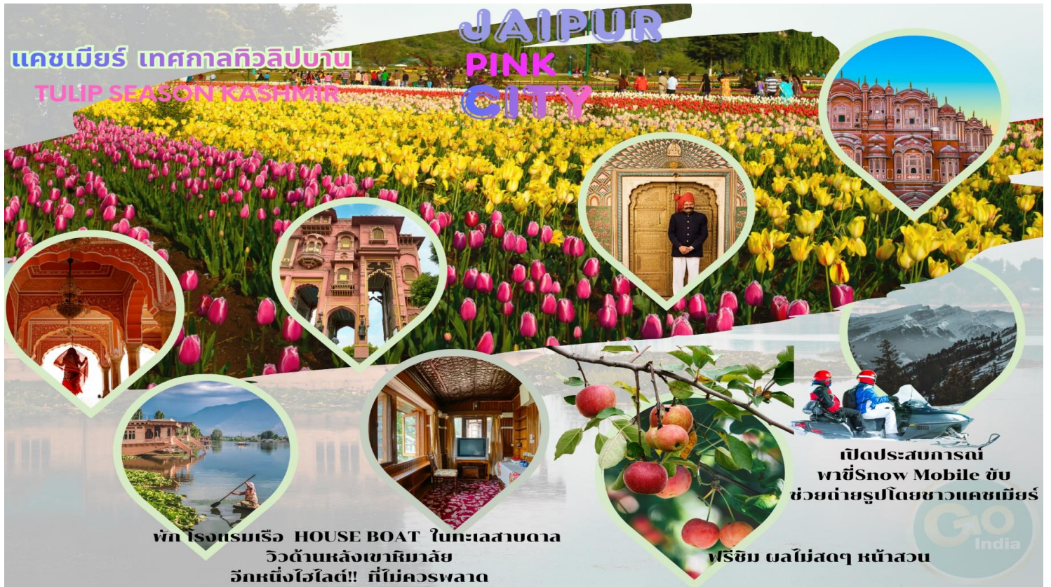
พัก ไร่องุ่นเรือ HOUSE BOAT ในทะเลสาบตา วิวด้านหลังเขาพิมายลัย อีกหนึ่งไฮไลต์!! ที่ไม่ควรพลาด