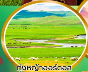
ทุ่งหญ้าออร์โดส

พิเศษ!!! สอบชุดของโกเลีย บนกระโจมของโกเลีย