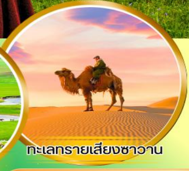
ทะเลทรายเสียงชาวน